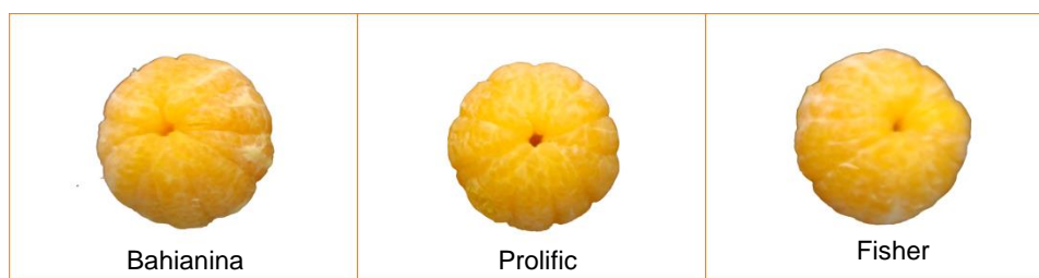
Figura 2: Naranjas de los cultivares Bahianina, Prolific y Fisher

Los resultados obtenidos sugieren que: no habría diferencias entre los cultivares en su facilidad de pelado. (Figura 2).