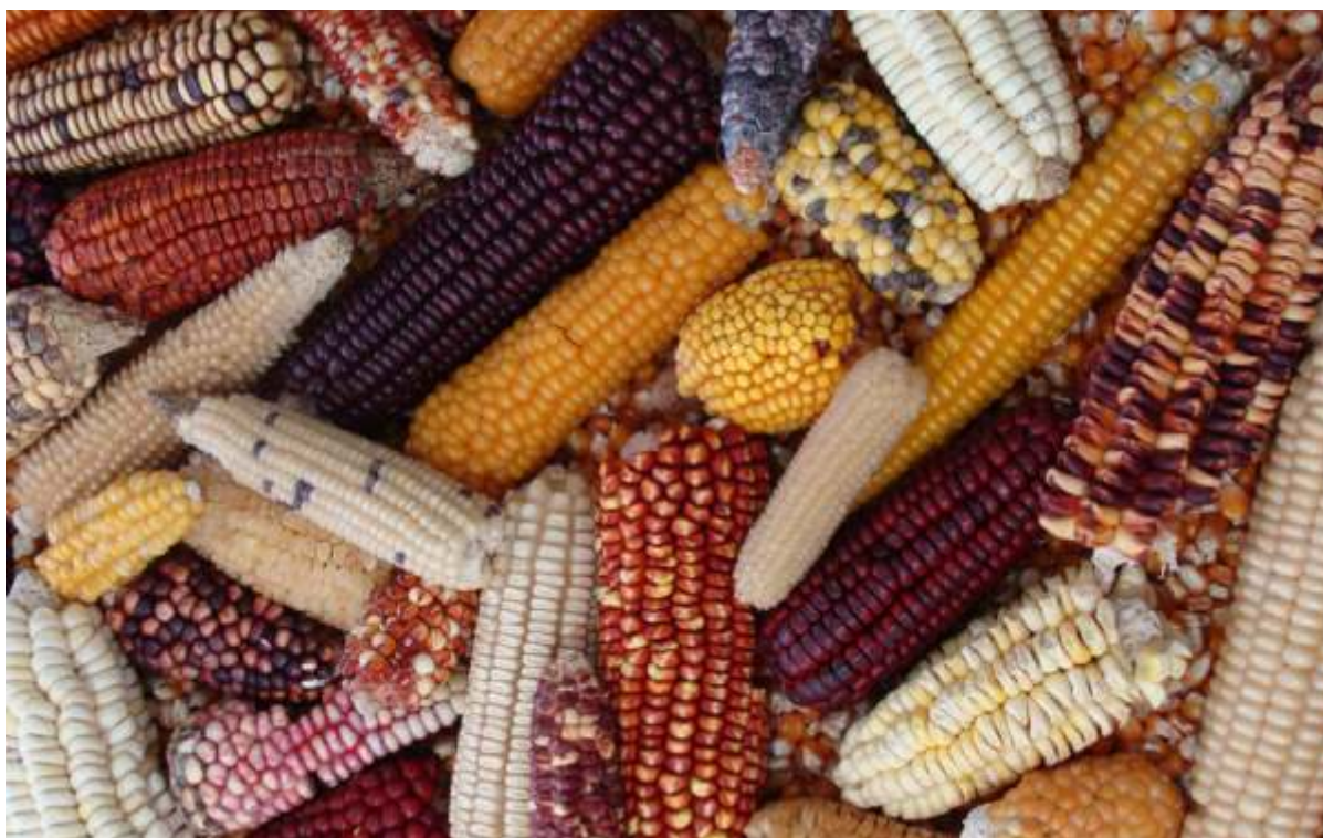
Maíces nativos de la Argentina conservados en el Banco de Maíz de la EEA Pergamino, INTA.

Sin embargo, la conservación y manejo de estos recursos en manos de los agricultores y su interacción con las iniciativas formales de conservación en el marco de programas nacionales han sido escasamente desarrolladas a nivel mundial y esa misma situación se visualiza en nuestro país. La conservación realizada por agricultores debe ser fomentada por todos los actores que desarrollan actividades en el área, ya que es la única iniciativa que