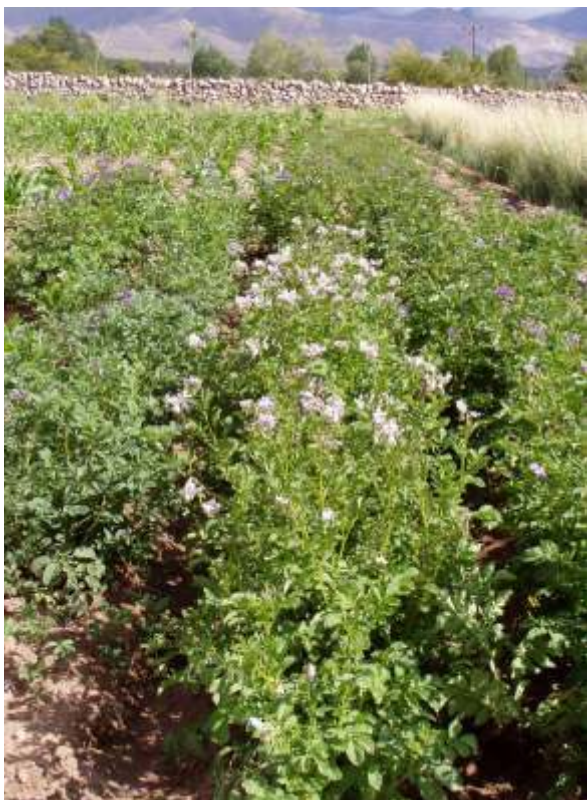
Plantas de papa nativa cultivadas en el campo de un agricultor andino.

Las investigaciones realizadas con las especies y cultivos que integran las distintas colecciones han permitido formular pautas para la óptima conservación de los materiales, así como detectar aquellos con resistencia genética tanto a enfermedades y plagas, como a sequías y heladas. También permitieron identificar materiales promisorios (en cuanto a calidad, productividad y/o valor nutritivo) y beneficiosos para las funciones fisiológicas del organismo humano y para diversos usos industriales. Para la documentación del germoplasma se han generado herramientas de software (DBGermo Web) desarrolladas en el INTA y utilizadas en la administración de las bases de datos de las colecciones vegetales preservadas en la Red.