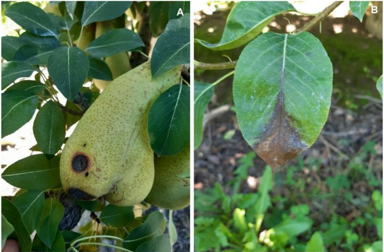
Figura 1. Síntoma de mancha marrón del peral en la variedad Abate Fetel, en fruto (A) y hoja (B).