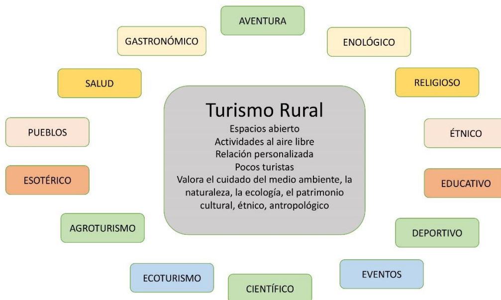
Figura 1. Modalidades del Turismo rural

nacional decretó para la cuarentena (ASPO y DISPO, alternativamente y con excepciones)”. Las modalidades que ofrece el Turismo rural pueden ser: aventura, enológico, religioso, étnico, educativo, deportivo, evento, ecoturismo, científico, agroturismo, esotérico, pueblos, salud, gastronómico. Es importante destacar que muchas de estas modalidades son compartidas con el turismo urbano y masivo.