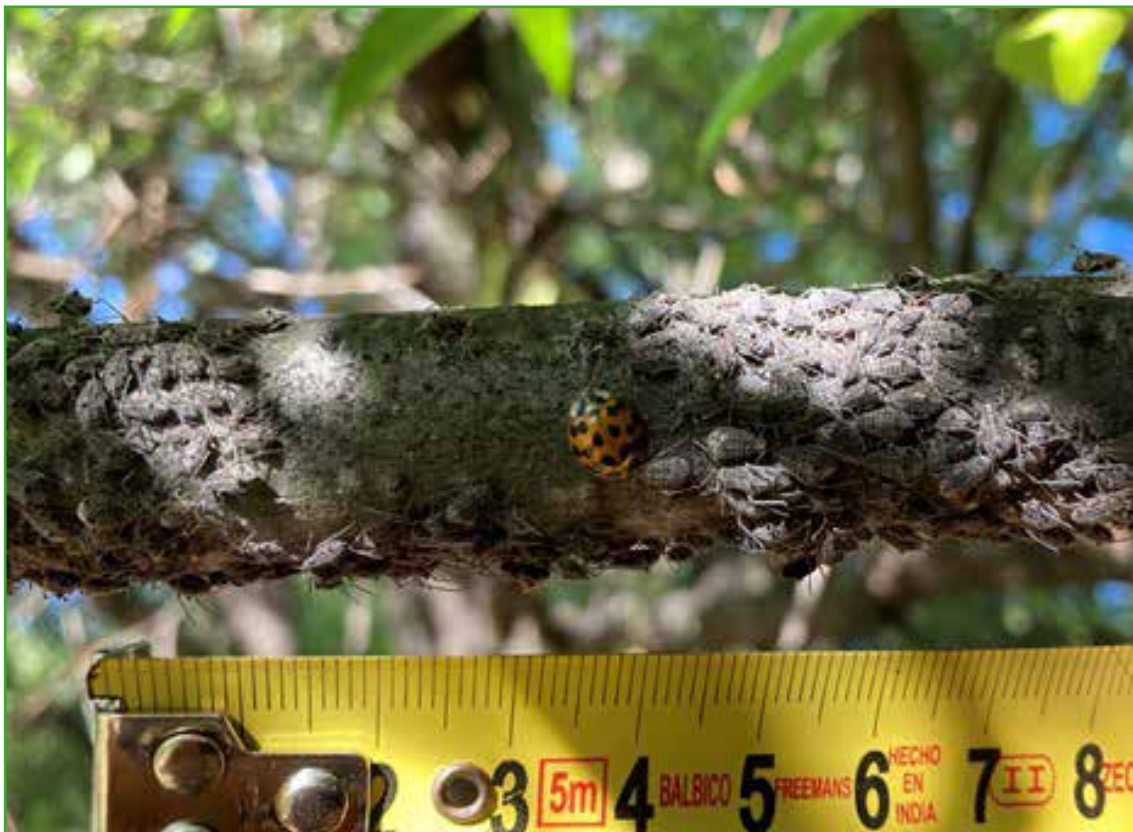
Figura 2: Colonia del pulgón gigante del sauce, Tuberolachnus salignus . También se observa un adulto del coleóptero conocido como vaquita de san Antonio, especie predadora del pulgón.

plantar sauces de aquellas variedades menos susceptibles a su ataque. Se ha demostrado que las tasas de reproducción de Tuberolachnus salignus difieren entre variedades y especies de sauce. Por otro lado, es conocido que este insecto puede ser parasitado por pequeñas avispas, abejas y hormigas, y predado por las "vaquitas de San Antonio" (Figura 2). Por lo tanto, estrategias que favorezcan la presencia de estas especies podrían contribuir de manera significativa al manejo de las poblaciones de pulgones.