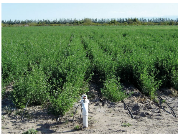
■ Figura 6. Cultivo establecido con riego por goteo.

Por un lado, estas ventajas son de consideración cuando el objetivo es cultivar superficies importantes y obtener una alta producción de semilla de excelente calidad. No obstante, su principal inconveniente es el alto costo inicial de equipos y de instalación, cosa que, por otro lado, puede verse atenuada por los altos rendimientos de semilla que produce y por la disminución o eliminación de otros costos (sistematización del terreno, mano de obra, pulverizaciones, etc.) (Figura 6). De cualquier modo, por tratarse de una tecnología nueva para la producción de semilla de alfalfa en nuestro país, se debe todavía generar la información necesaria que permita adecuar su uso a los requerimientos de cada situación.