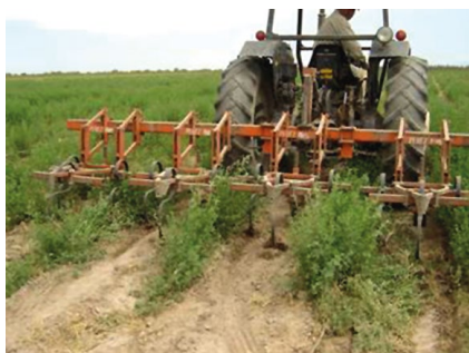
Figura 7. Control mecánico de malezas.

La eliminación de las malezas por medios mecánicos suele ser un método de control económico. El cultivo en hileras distanciadas facilita la utilización de diferentes implementos, tales como rastra de discos, escardillo, carpidores, cultivadores rotativos, vibro cultivadores, etc. (Figura 7). La labor entre hileras se realiza las veces que sea necesario, dejando sin cultivar una franja de 0,15 m a cada lado de la planta. Para decidir el momento y la frecuencia de las labores mecánicas, debe tenerse en cuenta el desarrollo de las plantas y el daño por pisoteo que se ocasiona al cultivo, que en algunos casos puede ser de consideración. Es conveniente que el tractor esté provisto de rodados angostos, para evitar el excesivo pisoteo de tallos y la compactación del suelo.