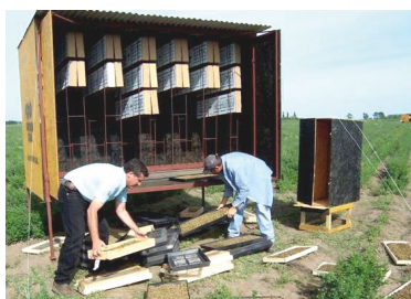
Figura 11. Domicilio fijo de M. rotundata dispuesto en un lote de alfalfa.

poliestireno expandido de alta densidad (telgopor), etc. (Arretz y Martínez; 1988; Bohart, 1962; Stephen, 1961). Los domicilios pueden ser unidades fijas de madera, con capacidad para 20.000 a 60.000 galerías de nidificación, o estructuras móviles de tamaño mediano a grande, con capacidad para 100.000 a 500.000 galerías de nidificación. Los primeros (pequeños y fijos) tienen bajo costo, pero proporcionan menor eficiencia de polinización (Figura 11). Los móviles y de mayor tamaño son más apropiados para polinizar superficies mayores y pueden ser trasladados dentro del lote según las variaciones de la floración; sin embargo, su mayor inconveniente es su alto costo.