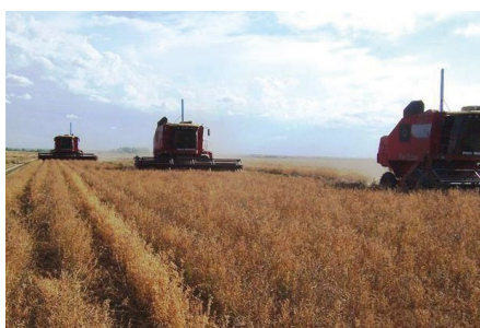
■ Figura 12. Cosecha directa de alfalfa.