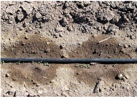
■ Figura 5. Germinación de la alfalfa en un sistema de riego por goteo.

En los últimos años se ha empleado con éxito en nuestro país otra tecnología de riego presurizado: el riego por goteo, con el que se han obtenido rendimientos de hasta 1.200 kg ha -1 en producciones comerciales de San Juan (Figura 5). Es importante considerar este sistema para situaciones donde la disponibilidad de agua para regadío es cada vez más escasa y más costosa.