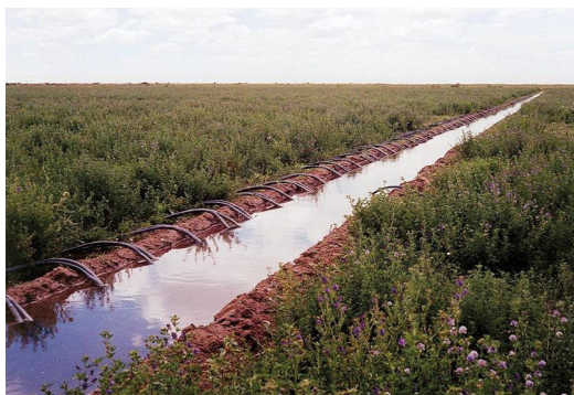
■ Figura 4. Cultivo para producción de semilla en hileras distanciadas.

En la mayoría de las áreas de riego de la Argentina, la distribución del agua de riego es superficial, por surco o inundación. En ese contexto, la adecuada sistematización del suelo adquiere una gran relevancia y el diseño de un apropiado sistema de riego debe ser una de las primeras consideraciones para tener en cuenta una vez elegido el lote. Una mala sistematización del riego no puede ser compensada por otras prácticas de manejo. Si se tiene una correcta sistematización del terreno, el uso de sifones portátiles de PVC permite uniformizar el caudal de agua a aplicar en cada surco de riego (Figura 4).