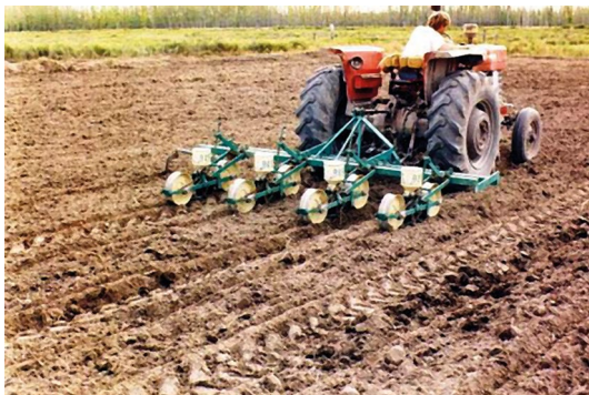
■ Figura 2. Siembra de alfalfa con sembradora de precisión.

Las densidades de siembra de 0,5 a 1 \text{ kg ha}^{-1} son suficientes para establecer entre 5 y 10 plantas cada 0,30 m de hilera, cuando las hileras están distanciadas entre sí a 0,90-1 m (Marble, 1987). Si bien la mayoría de las sembradoras comunes pueden ser modificadas para sembrar bajas densidades, es más recomendable la utilización de sembradoras de precisión (tipo Stanhay, Planet, etc.). La siembra puede hacerse con sistema de camellones (o surcos) o en plano, dependiendo la elección de cada uno de las características del suelo, del tipo de sembradora a utilizar y del sistema de riego disponible.