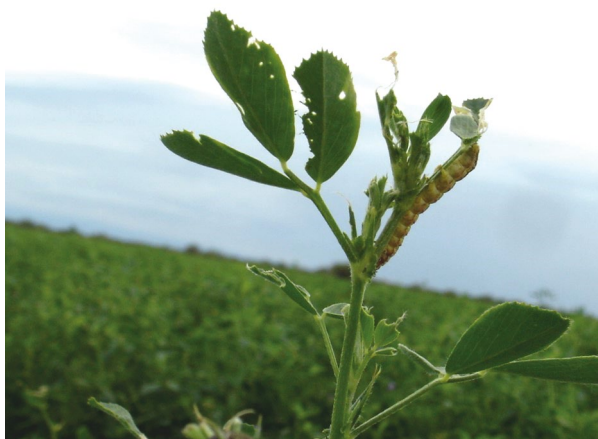
■ Figura 9. Ataque de isoca bolillera ( Helicoverpa geltopoeon ).

Se sugiere efectuar tratamientos de control cuando se detecte la presencia promedio de al menos una (1) chinche adulta (o ninfa mayor de 5 mm) por golpe de red, sobre un mínimo de 20 golpes distribuidos en el lote según un esquema de 4-5 golpes por estación de muestreo. Esta tarea debe repetirse cada semana, con mayor frecuencia en los períodos críticos de fructificación y maduración.