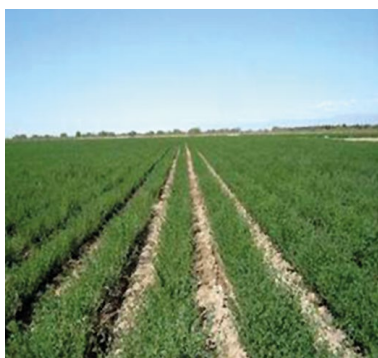
■ Figura 3. Cultivo para producción de semilla en hileras distanciadas.

Para las condiciones de algunas regiones de EE. UU., Marble (1987) concluyó que el distanciamiento óptimo para suelos arcillo-limosos es de 0,90-1 m en áreas con períodos de crecimiento largos y de 0,70-0,80 m en áreas con períodos de crecimiento cortos; y en suelos arenosos y profundos, donde las plantas son más vigorosas y de mayor tamaño, la distancia óptima entre hileras es de 1-1,5 m.