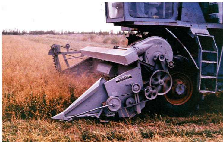
■ Figura 13. Cosechadora con plataforma provista de picos sopladores (air jet) y cuchilla de corte vertical.

Si se utiliza el método de cosecha directa, se aumenta la eficiencia de la operación colocando una cuchilla de corte vertical en el lateral derecho de la plataforma de corte de la cosechadora, en reemplazo del tradicional divisor de cultivo (Figura 13). Para cultivos implantados en hileras distanciadas, se hace necesario el uso de puntones levantadores. El molinete se utiliza solamente en el caso de cultivos ralos. La velocidad del sinfín de la plataforma debe reducirse aproximadamente al 50 % de la recomendada por el fabricante, a efectos de evitar atoramientos del material que entra al acarreador. La detallada observación de lo anteriormente citado, además de la precaución de realizar un corte lo más bajo posible cuando el terreno es parejo, minimiza las pérdidas durante la cosecha (Goss, 1975; Goss et al. , 1977; Harmond et al. , 1961; Marble, 1976; Moschetti y Dell'Agostino, 1982).