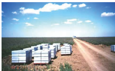
■ Figura 10. Ubicación de colmenas en un lote de producción.

abejas recolectoras de polen entre dos lotes de alfalfa adyacentes, lo que indicaría la existencia de diferencias en la condición de las plantas más que la competencia de otras fuentes de polen. El riego es una de las prácticas de manejo que más afecta el número de abejas presentes en un lote (Marble, 1980; Martínez et al. , 1983; Poduska, 1977).