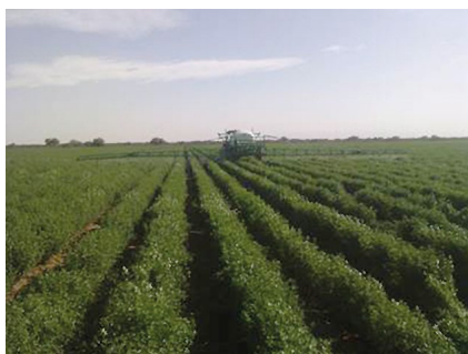
■ Figura 8. Control químico de malezas.

Las gramíneas perennes, como gramón y sorgo de Alepo, pueden ser controladas con aplicaciones de los herbicidas selectivos mencionados anteriormente. También la aplicación de glifosato (500 a 1000 g i.a. ha -1 ) durante los meses de bajas temperaturas y sin rebrote activo de la alfalfa ha dado resultados satisfactorios.