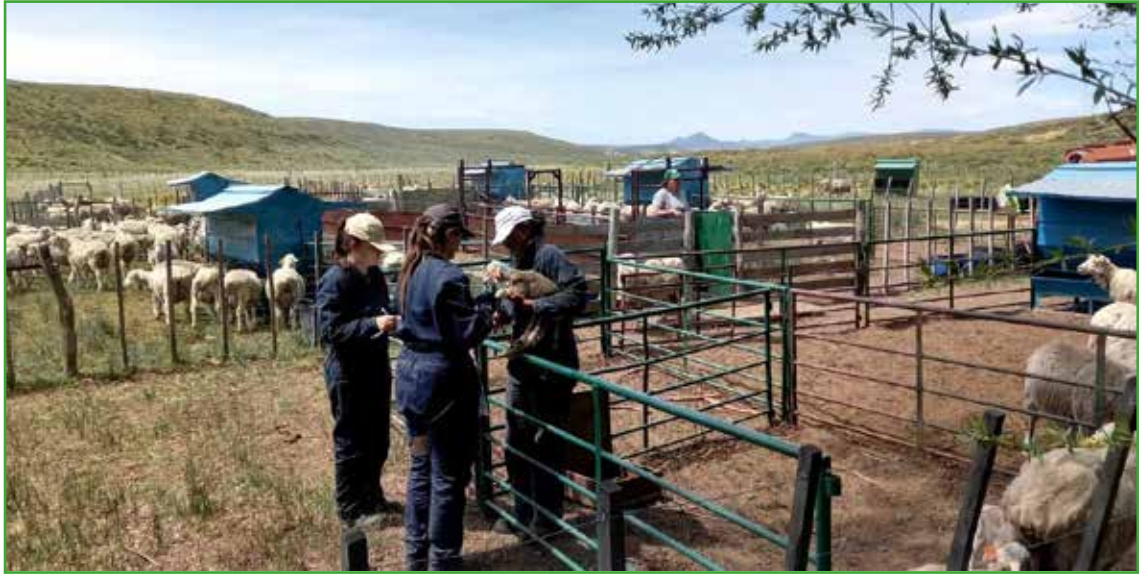
Figura 2: Corrales con comederos de autoconsumo, adyacentes al potrero reservado.

La parición controlada es una actividad que requiere condiciones tranquilas, sin perros ni ruidos fuertes para no estresar a los animales, espacio suficiente, y mano de obra entrenada. En el caso de esta experiencia y por tratarse de estudios experimentales, trabajaron cinco personas, pero el manejo bien podría ser realizado por una o dos personas, dependiendo del tipo de servicio utilizado, la concentración de los partos y la cantidad de ovejas. La jornada, de 6:00h a 20:00h, consistía en observar los corrales y separar las ovejas que comenzaban el trabajo de parto para llevarlas a su brete individual. Una vez que la oveja paría, se aseguraba que el cordero ingiriera calostro y generara el vínculo con la madre. Se registraba el peso al nacer y se caravaneaba la cría. Una vez tomados los datos, dependiendo del estado del cordero y el vínculo madre-cría, la madre y su cría eran resguardados bajo cobertizo por uno o dos días. Luego se trasladaban a un potrero al lado del cobertizo, reservado con pasto y agua.