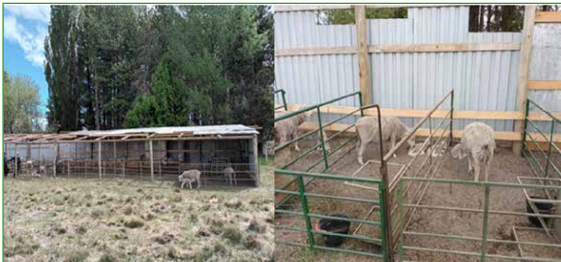
Figura 1: Cobertizo utilizado en la experiencia 2022 y detalle de los animales en sus bretes individuales.

El cobertizo del Campo Experimental se construyó de 20 m x 5 m, orientado hacia el este, en un cuadro donde las ovejas tenían disponibilidad de agua y un potrero reservado para el posparto. Dentro del cobertizo se armaron bretes individuales móviles, para que las ovejas pudieran estar tranquilas y generar el vínculo con su cría, ya que es fundamental que los corderos puedan tomar calostro durante las primeras horas de vida.