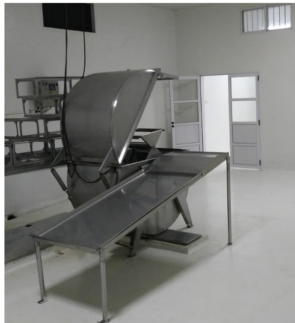
Imagen 2 Sala de extracción de miel

La sala de extracción de miel (Imagen 2) está ubicada en la zona rural, a 5 km al oeste de Tostado en un predio de 10.000 m 2 cedido por la Sociedad Rural de Tostado, en comodato por 50 años para su funcionamiento (Imagen 3).