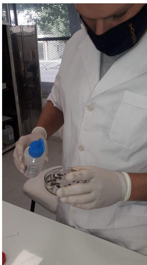
Figura 3. Pruebas de inmersión de garrapatas en diferentes acaricidas en el laboratorio de la EEA INTA Reconquista