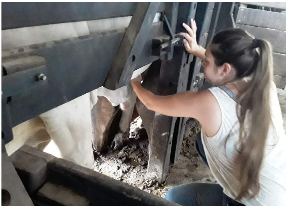
Figura 2. Colecta de garrapatas en estado teleoginas en un establecimiento de Reconquista