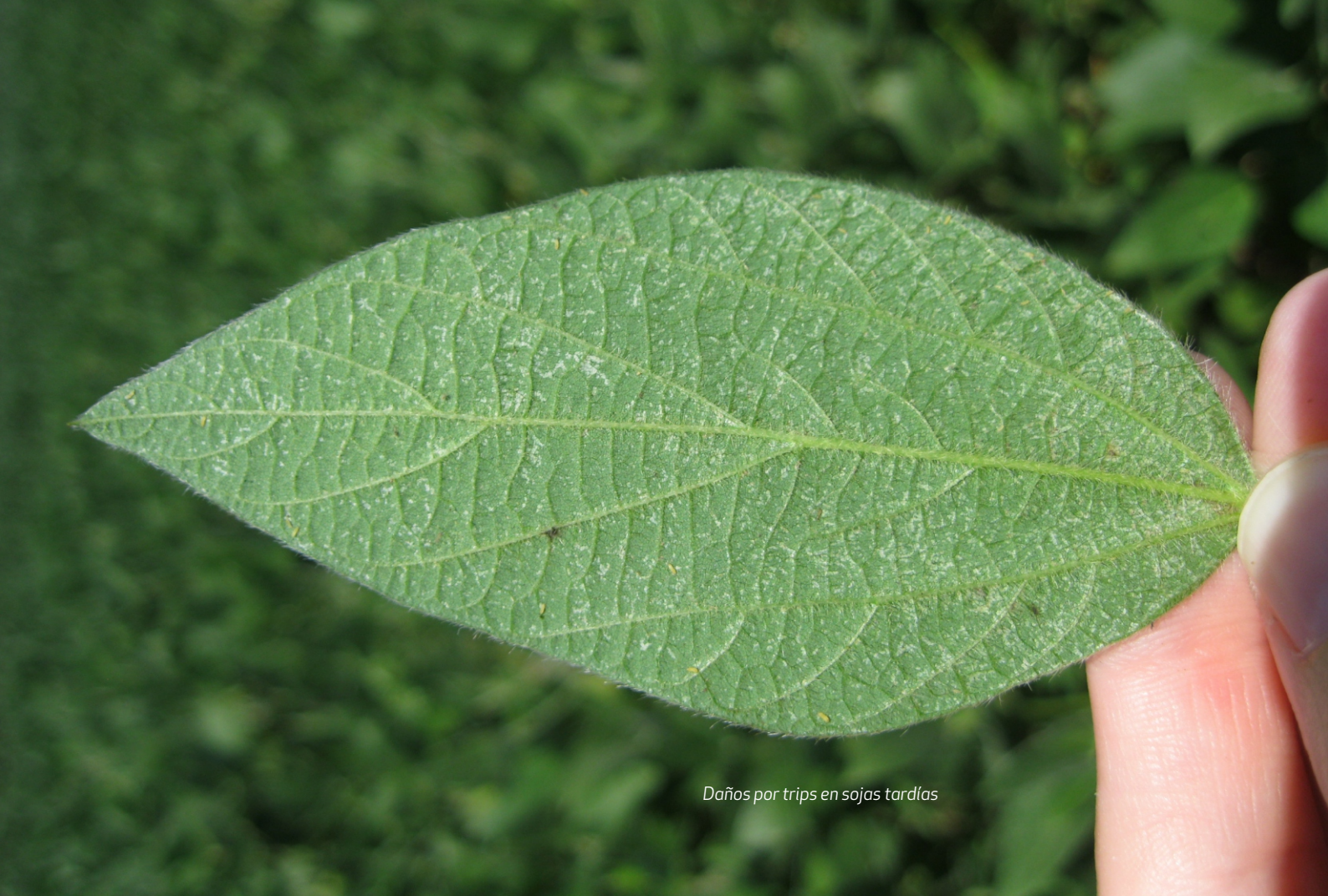
Daños por trips en sojas tardías