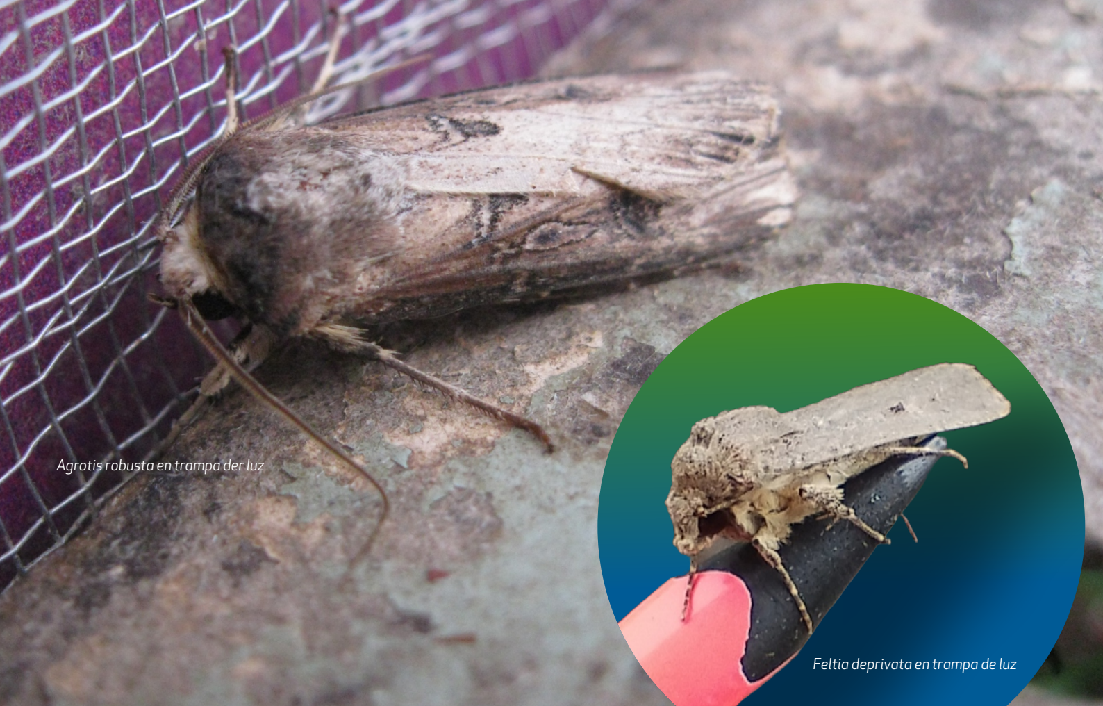
Agrotis robusta en trampa de luz