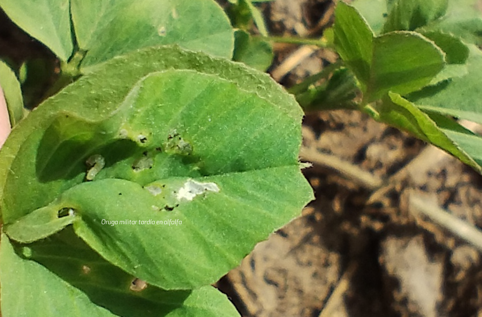
Oruga militar tardía en alfalfa