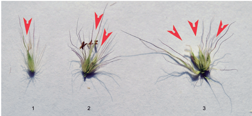
Figura 7. Número de espiguillas fértiles (flechas) en involucros de C. ciliaris . (Fuente: Sabrina Griffa; IFRGV-CIAP).