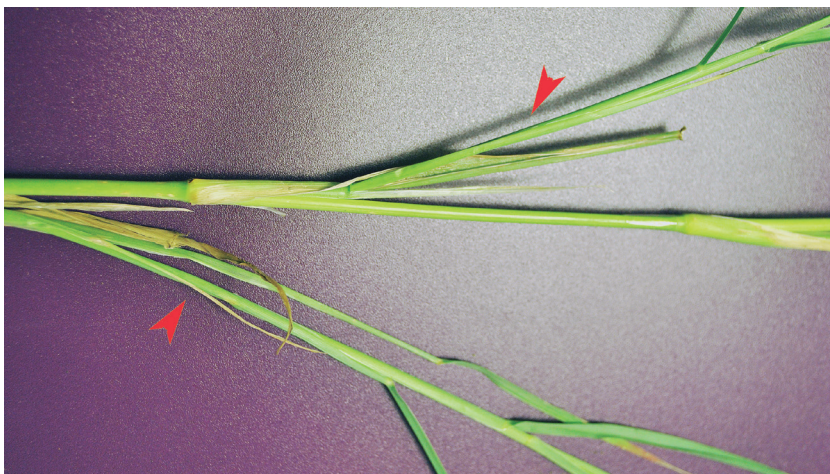
Figura 6. Ejes secundarios fértiles en C. ciliaris L. (flechas) sobre el eje principal.