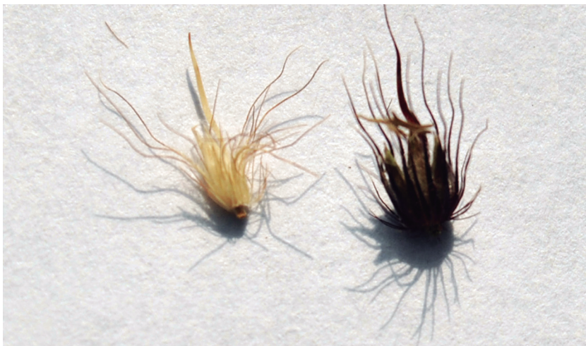
Figura 8. Color de setas involucrales a la cosecha en C. ciliaris : marrón pajizo y púrpura (de izquierda a derecha). (Fuente: Sabrina Griffa; IFRGV-CIAP).