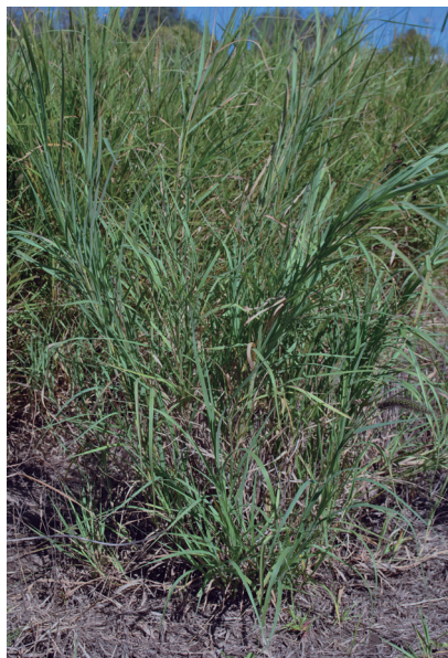
Figura 3B. Color del follaje en vista general de planta. A modo de ejemplo: verde oscuro brillante (arriba) y verde azulado ceniciento (abajo). (Fuente: María Inés Cavalleros; EEA Ing. Juárez, Formosa).