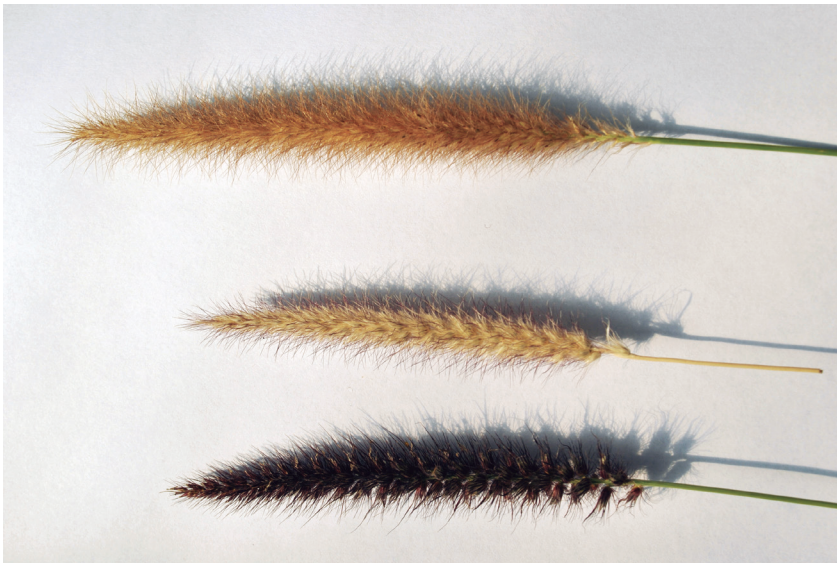
Figura 9. Detalle de la densidad de panoja en Cenchrus ciliaris L. De arriba hacia abajo: densa, media y escasa. (Fuente: Sabrina Griffa; IFRGV-CIAP).