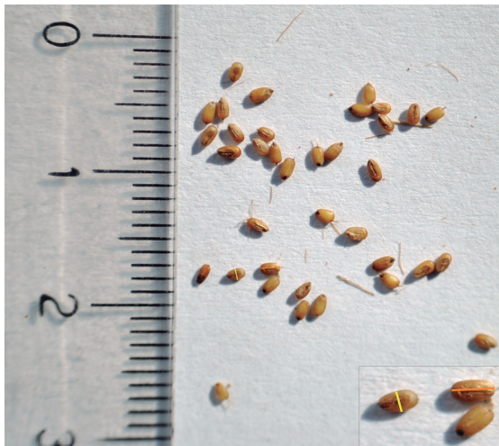
Figura 10. Mediciones realizadas para la longitud de cariopsis, en los segmentos mayores (barra naranja) y ancho de cariopsis, en los segmentos menores (barra amarilla) de cariopsis maduros de C. ciliaris L..