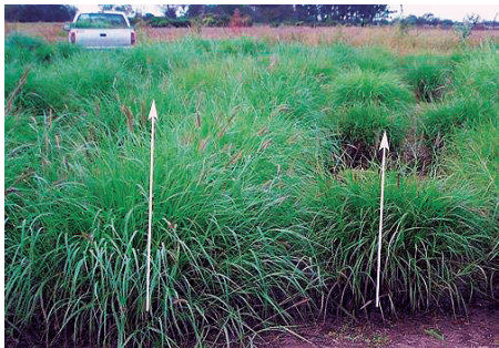
Figura 4. Comparación de altura de planta de C. ciliaris L. Flechas indican la forma de medición desde el suelo al ápice de la panoja.