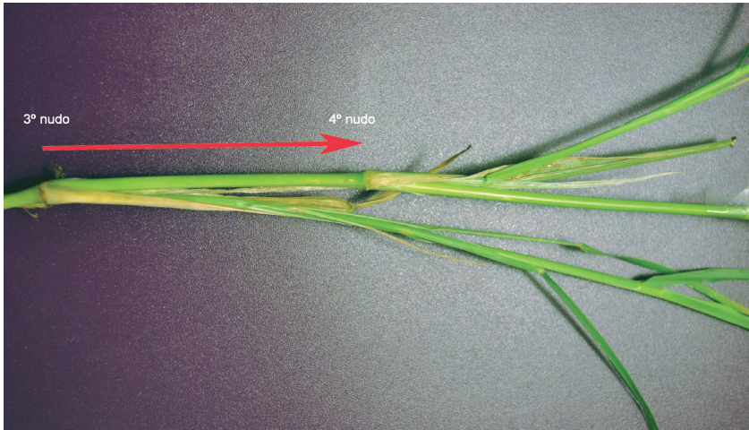
Figura 5. Medición de la longitud internodal entre el 3.º y 4.º nudo de un macollo principal en C. ciliaris L..