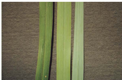
Figura 3A. Color de follaje. Vista en lámina foliar de C. ciliaris L. A modo de ejemplo se muestran: verde oscuro brillante, verde claro, verde azulado ceniciento (de izquierda a derecha). (Fuente: Sabrina Griffa; IFRGV-CIAP).