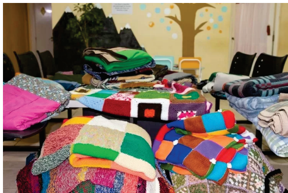
La buena onda, que es autogestivo, que acerca la producción local, que es parte, y generadora, de redes necesarias de las que también quiero ser parte

Más allá de los objetivos económicos, muchos espacios buscan insertarse dentro de sus comunidades, participando y colaborando en actividades que exceden los fines con los cuales se crearon. Realizan festivales o colectas solidarias, campañas de difusión de problemáticas sociales y ambientales. Para ello, establecen vínculos diferentes con actores culturales, sociales, económicos, con el Estado y con los consumidores. Estos sentidos de lugar se nutren de valores que priorizan el cuidado mutuo, la solidaridad y lo comunitario.