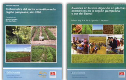
Figuras 3 y 4: publicación de información para productores y técnicos

http://inta.gob.ar/documentos/boletines-digitales-desde-la-eea-san-pedro ), contribuyó a la comunicación del sector.