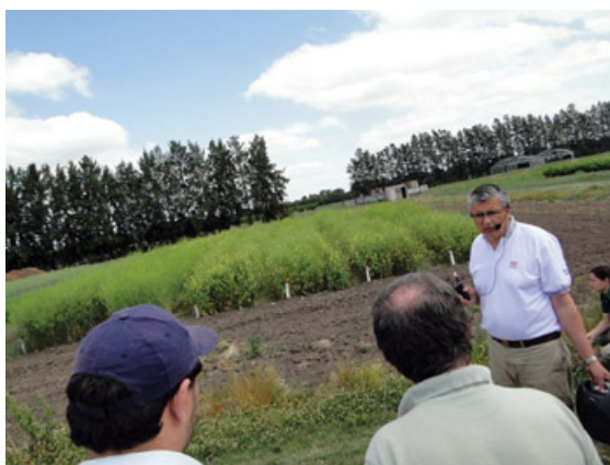
Figura 2: Jornada de capacitación en INTA San Pedro

En 2014, se relevaron en Argentina, 5000 has sembradas principalmente en las provincias de Entre Ríos, Santa Fe, Córdoba y Buenos Aires (figura 1). Los rendimientos logrados todavía distan del potencial obtenido durante años en ensayos en distintas localidades, aunque con avances, falta ajustar aspectos del manejo del cultivo.