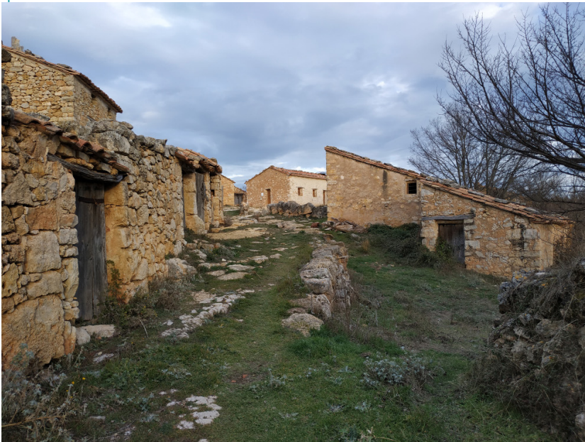
Aldea de Mas Blanco (Teruel), donde se pretendía construir una urbanización turística con campo de golf.

Un tercer foco de conflictos se puede identificar en torno a los procesos de banalización e invención de nuevas tradiciones para el goce del turista, contribuyendo a convertir determinadas áreas rurales en una suerte de parques temáticos y anteponiendo este papel al de asegurar una mínima calidad de vida o bienestar para la población. Esto es lo que sucede con numerosas fiestas patronales, romerías y festivales de verano que se han convertido en grandes eventos masificados con espectáculos con música comercial y abundante alcohol.