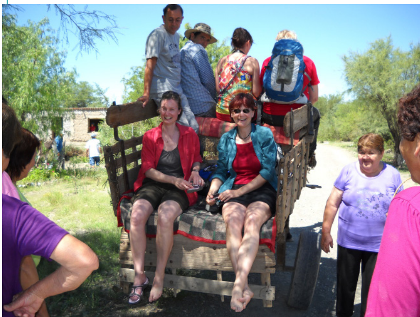
Paseo en sulky por Gran China con contingente alemán.

El circuito enfrenta algunas dificultades como ser el limitado acceso a servicios como internet y telefonía celular (para que los turistas se puedan contactar más fácilmente); escasez de financiamiento para mejoras en la infraestructura y los servicios, carencia en el diseño de una estrategia de comunicación integral que promocióne el circuito y ausencia de capacitación en normas de calidad BPA, BPM, IRAM SECTUR, entre otras.