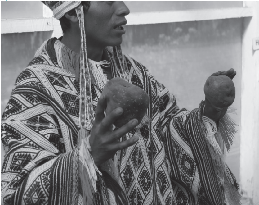
Comunero del Parque de la Papa explicando a turistas la recuperación de papas nativas.

En el Parque de la Papa en los Andes peruanos, uno de los proyectos de turismo rural y patrimonial más exitosos que hayan sido documentados 3 , surgieron tensiones respecto al valor del suelo que estuvieron a punto de poner en peligro toda su actividad.