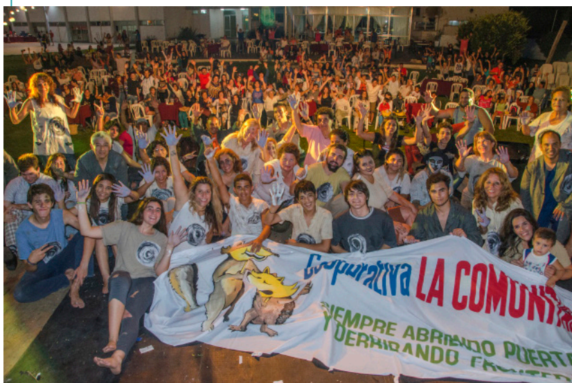
Cooperativa La Comunitaria/ Grupo de Teatro Comunitario de Rivadavia.

gestión e implementación de políticas culturales en grupos de teatro comunitario de zonas rurales y urbanas. Estudio comparativo de los casos Catalinas Sur y Teatro Comunitario de Rivadavia (2002-2015)". A partir de este trabajo, el campo de las políticas culturales se convirtió en un terreno fértil para pensar el modo en que los grupos acceden, disputan, diseñan e implementan dichas políticas. A su vez, estas cuestiones nos llevaron a pensar en las instancias de participación que los grupos tienen para intervenir activamente de la producción de políticas culturales y fortalecer el ejercicio de una ciudadanía políticamente comprometida.