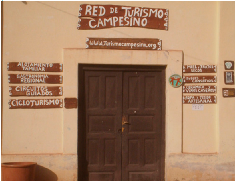
Oficina inicial de la Red de Turismo Campesino en San Carlos, Salta.