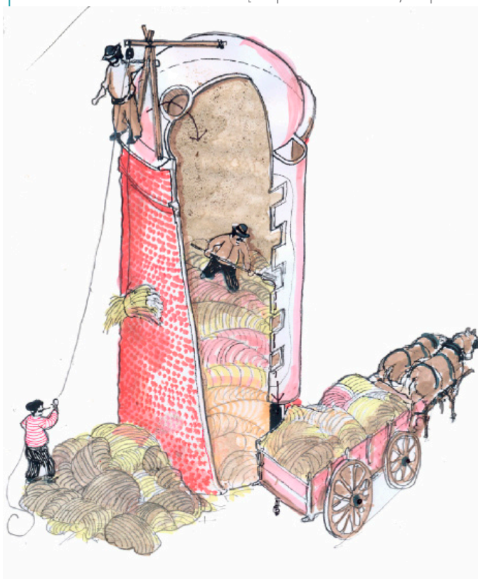
Silo para forraje en Cañuelas (circa 1920).