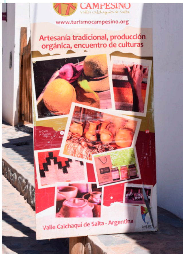
Atractivos de la Red de Turismo Campesino.

prefieren recibir a viajeros antes que a turistas, debido a que consideran que los primeros tienen mayor interés por conocer, se sienten como en casa, no exigen comodidades y viajan tranquilos. En relación a los turistas, consideran que tienen prisa, están de paso; exigen comodidades y su principal interés radica en ver más que en el conocer.