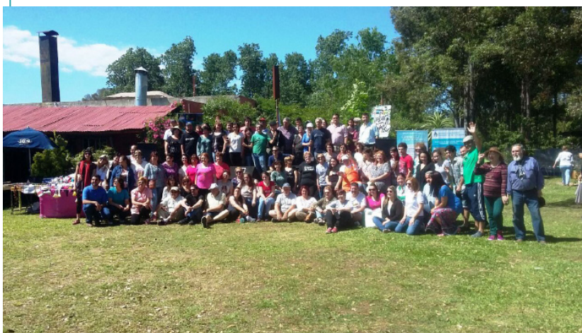
Productores, emprendedores y técnicos en la Feria de la Ruta del Turismo Rural del Corredor del Uruguay.

Este proyecto se basa en las experiencias asociativas relacionadas al quehacer de INTA en articulación con los organismos provinciales, municipales, microregionales y actores estratégicos del sector. El objetivo planteado, consiste en contribuir al desarrollo territorial con identidad cultural de la zona, tomando como herramienta fundamental al turismo rural.