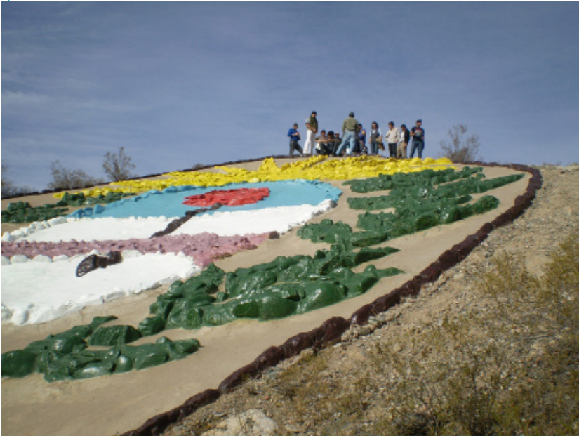
Escalada al Escudo Nacional (La Falda, Jáchal), con un contingente de Chubut. Grupo La Faldeñita.