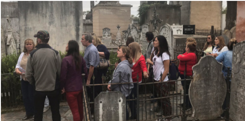
Visita guiada y charla en el cementerio municipal de San Antonio de Areco. Día Nacional de los Monumentos (4 y 5 de mayo de 2019).

A partir del año 2012 y durante un tiempo, desde el área de Planificación de la municipalidad, se trabajó en relevar, limpiar y pintar aquellos monumentos funerarios y tumbas de valor arquitectónico o histórico del cementerio municipal. En el 2018 se retomó el trabajo, incorporando a la visión museográfica una mirada interdisciplinaria para la interpretación del patrimonio funerario. En efecto, se comenzó a trabajar sobre una idea integradora para acercar la necrópolis a la comunidad, utilizando herramientas conceptuales de la sociología, la arqueología, la antropología y otras ciencias sociales.