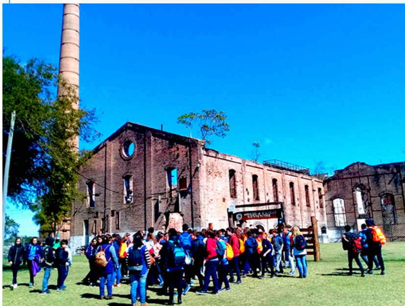
Ex fábrica de tanino en Villa Ana, Santa Fe. Actividad turística con estudiantes (2019).