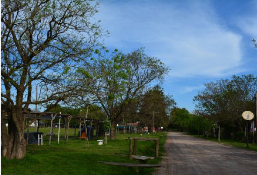
Plaza de Tomás Jofré durante un día de semana.

mana, pudiendo duplicar esta cifra en el inicio de la primavera o sextuplicarla en las fiestas populares que organiza el municipio 2 .