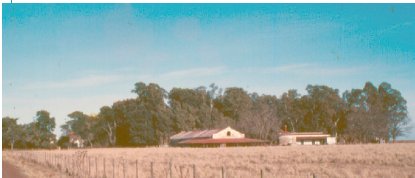
Antiguo casco de “El Sol Argentino” con su microclima producido por un cortavientos perimetral de eucaliptus. Partido de Benito Juárez, provincia de Buenos Aires, 1865.

Desde hace mucho se relaciona al patrimonio cultural con historias que deben contener mucho bronce y poco cuero y fierro; mucho parque diseñado y castillos en la pampa, y poco rancho. Tratando de rescatar ausencias, presentaremos a continuación, entre otros temas, el patrimonio del trabajo en sus diferentes aspectos (industrial, rural, infraestructura, etc.). Algunos países se nos han adelantado en estas valorizaciones pero, nunca es tarde.