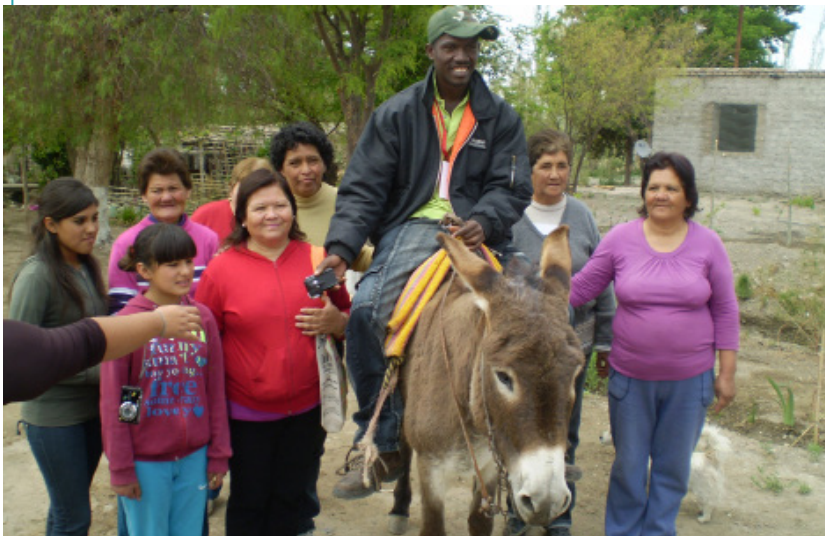
Paseo en burro con turista venezolano. Gran China.