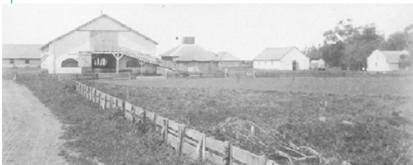
Galpón de esquila Estancia San Juan, con su rampa para ovejas (circa 1870).