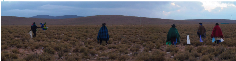
Comunidades Andinas Manejadoras de Vicuñas, Puna Jujfeña.

De la misma manera, se puede acceder al Facebook “Comunidades Andinas Manejadoras de Vicuñas”