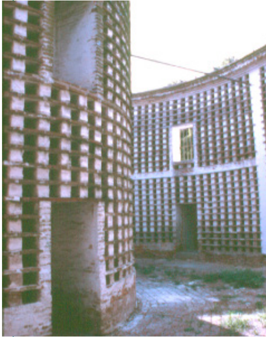
Interior del palomar de Diego Caseros (1788).