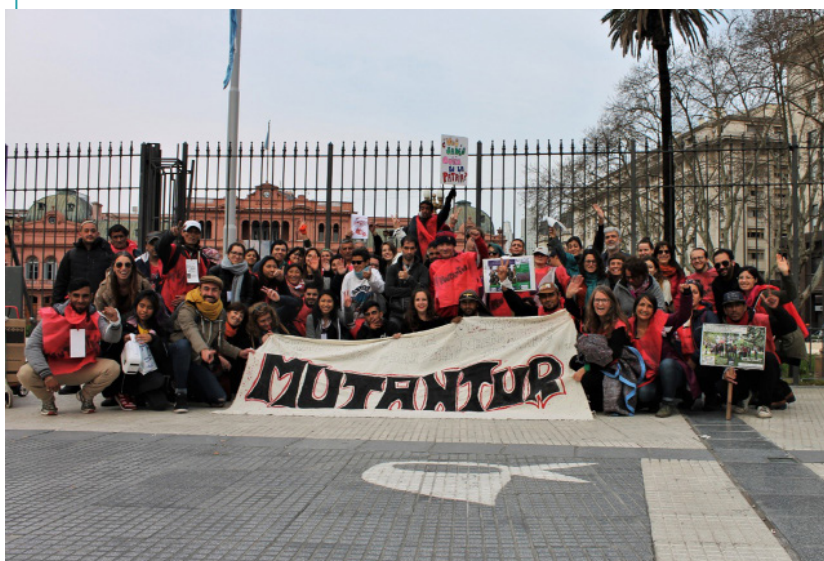
Mutantur en Plaza de Mayo, circuito "Y para vos, ¿qué es la Patria?" (Agosto de 2019)

El objetivo de narrar(nos) es contar memorias insolentes en las que estemos incluidos y, de ese modo, deconstruir los relatos hegemónicos que excluyen a determinados sectores de población, visibilizando los relatos subalternos construidos desde abajo.