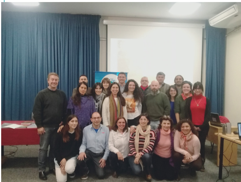
Participantes de las II Jornadas de Turismo Rural, Patrimonio y Territorio (2019).