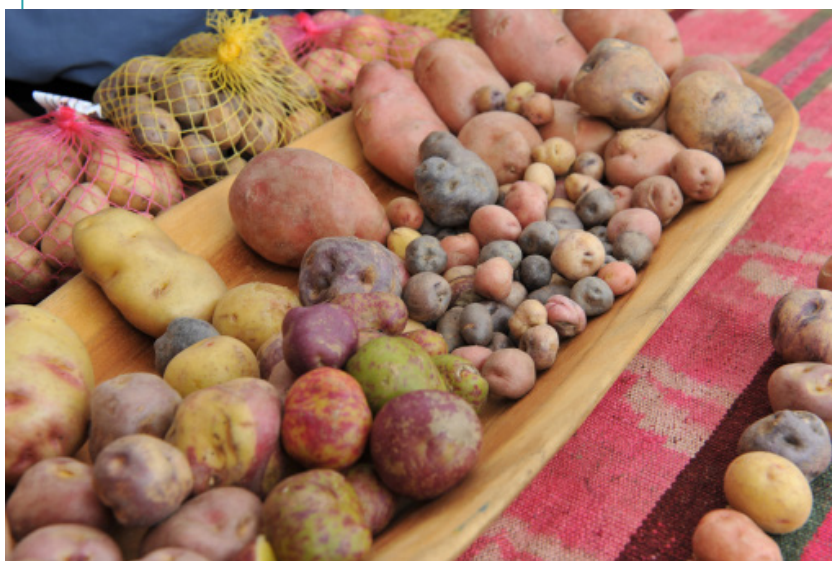
Papines andinos. Proyecto de restauración de genoma.

Estas consideraciones buscan, finalmente, enfatizar el carácter construido de los alimentos territoriales: no "están en el territorio" sino que son activados o promovidos como tales en determinado momento, por parte de ciertos actores y en base a determinados intereses y recursos. Y el modo en que se transite ese proceso derivará, o no, en el mejoramiento de las condiciones de vida y trabajo de los productores (en particular de aquellos empobrecidos o en crisis), en el reconocimiento de la diversidad productiva y cultural, y en el consumo de mejores alimentos.