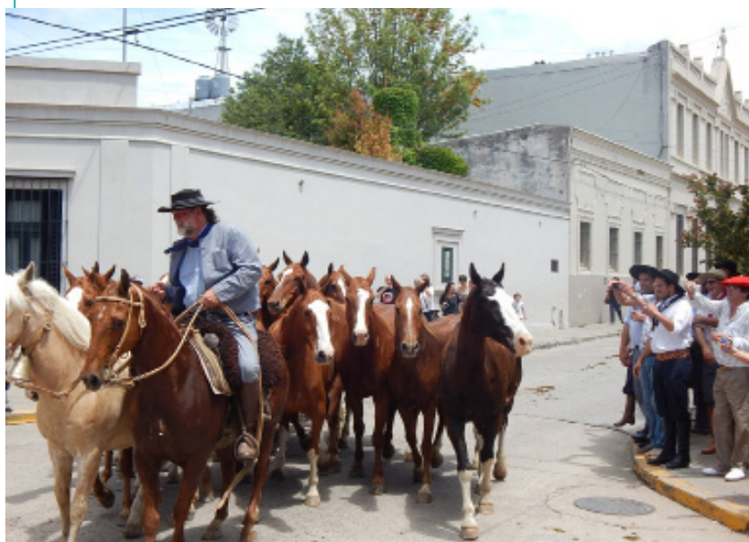
Fiesta de la Tradición, San Antonio de Areco (2015).

Todos los procesos de patrimonialización descriptos suelen legitimarse con relatos que dan cuenta de las historias y geografías de los lugares, pero que ofrecen una versión simplificada y armónica de los mismos. Estas narrativas, en primer lugar, suelen invisibilizar la participación de las poblaciones indígenas, de los afrodescendientes y de las mujeres en la construcción de lo rural. En segundo lugar, presentan los espacios rurales como ámbitos idílicos, donde se puede llevar una vida segura y tranquila. En tercer lugar, lo rural se concibe como refugio de lo natural y reservorio de la identidad nacional.