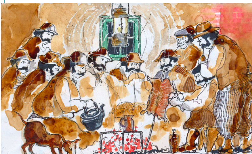
Trabajadores rurales en la materia al amanecer, preparándose para salir al campo.