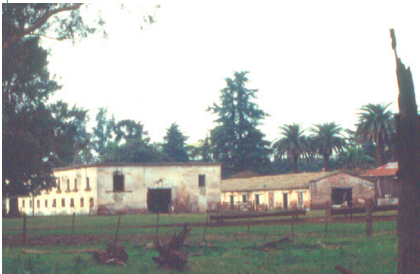
Antiguo galpón de La Caledonia (circa 1840), posiblemente el más antiguo de la provincia de Buenos Aires con techo de azotea. Al fondo, galpón con cubierta de tejas francesas (circa 1870).

una región hasta, en el otro extremo, una choza o un rancho. Los dos son referentes de la memoria rural.