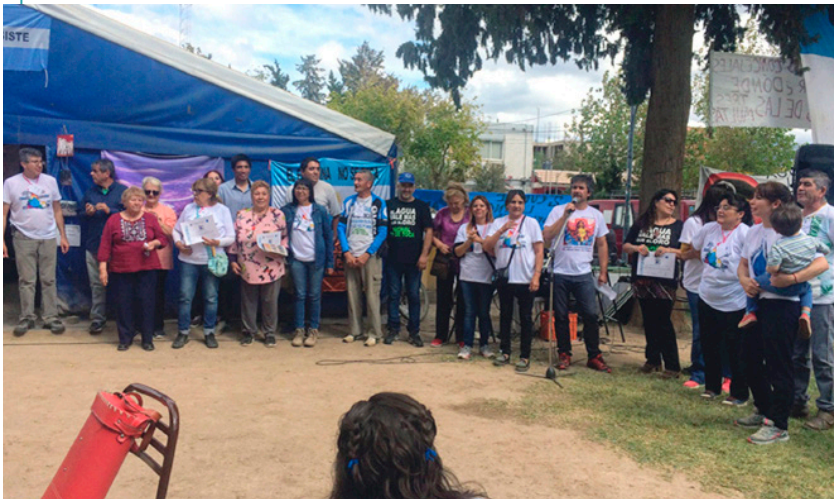
Carpa e integrantes de la Asamblea Jáchal No Se Toca, en la Segunda Cumbre Latinoamericana del Agua para los Pueblos, abril 2019.

Ante lo expuesto, cabe preguntarnos ¿qué papel tienen las políticas públicas en territorios donde hay conflictos ambientales que han tomado estado público?, ¿qué dimensiones tener en cuenta al diseñar y gestionar una propuesta turística pertinente en situaciones como esta, donde existe una conflictividad ambiental y no se puede garantizar un ambiente sano ni para lxs pobladorxs ni para lxs visitantes?