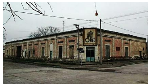
Antiguo Hotel Pappatico en Patagones

La llegada del ferrocarril en 1922 con un servicio regular de pasajeros y cargas desde Carmen de Patagones a Constitución modificó radicalmente la forma de transportar la lana, perdiendo protagonismo la vía fluvial. Según el registro oficial de la Subprefectura de Patagones, a las 9 horas del 17 de mayo de 1943, zarpo con destino a Buenos Aires, el buque carguero a motor Patagonia con 127 toneladas de carga, el capitán y 43 tripulantes. Fue este, el último carguero marítimo que ingresó al puerto de Patagones.