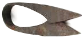
Antigua tijera con arco.

A partir de estos cambios inducidos por la domesticación, apareció la figura del Esquilador . Se trata de la persona que se dedicaba a cortar la lana de los animales. Las primeras esquilas, se realizaban con cualquier elemento cortante que pudiera seccionar las fibras, con la evolución aparecieron las tijeras de esquila, cuchillas unidas por un arco. A fines del siglo XIX, la empresa Wolseley en Inglaterra, comenzó a fabricar las primeras máquinas de esquila, que utilizaban una fuente de energía externa, que no era la mano del esquilador. Estas tijeras mecánicas, con pequeños cambios, son las que se utilizan en la actualidad para la esquila de los ovinos.