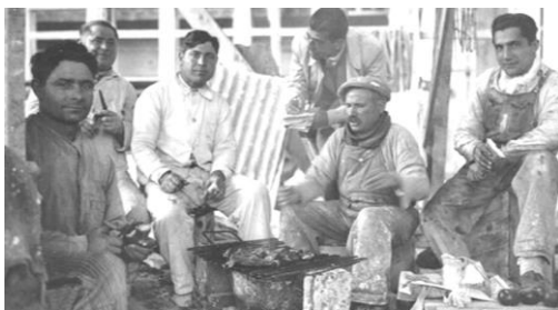
Integrantes de la comparsa de esquila.

Con el correr del tiempo y el aumento de la cantidad de estos animales factibles de ser esquilados, se conformaron las denominadas Comparsas de esquila integradas por grupos de personas con roles bien definidos, esquiladores, playeros, meseros, preneros, mecánico y cocinero. Estos grupos de a caballo y con carros recorrían los campos montados y desmontando los bártulos, como circos ambulantes, en una rutina que los llevaba a convivir meses, hasta que terminaba la zafra.