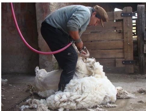
Muro Morales Comparsa Padre de Campeone

Los créditos otorgados, eran muy convenientes, ya que tenían dos años de gracia y cinco de pago a valor nominal, lo que les permitió trabajar y juntar el dinero para el pago de la cuota holgadamente. Estos fondos fueron destinados a la compra de maquinaria moderna, como generadores eléctricos, bajadas y afiladoras portátiles, tijeras mecánicas de última generación y prensas hidráulicas con motor a explosión, posicionándolas dentro de las mejor equipadas del país.