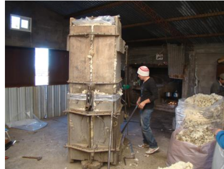
Prensa a krike, comparsa La Bienvenida.

Este equipamiento estuvo vigente durante décadas, a partir de lo cual comenzaron a aparecer los equipos que vemos en la actualidad, más livianos, fáciles de transportar y de manipular con prensas hidráulicas, generadores y motores eléctricos.