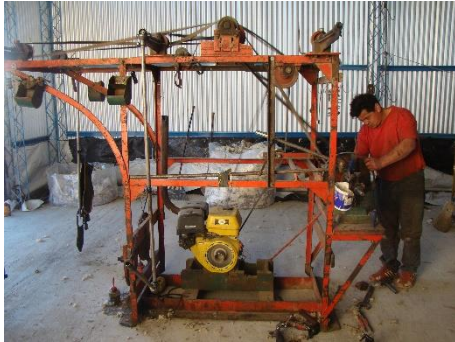
Cuadro 5 bajadas Toti Villagra.

Con el correr de los años, estas comparsas comenzaron a mecanizarse, contando con carros donde se montaba la maquina o cuadros metálicos portátiles que se bajaban en cada establecimiento. Estos contaban con un motor a explosión que generaba la fuerza motriz para hacer funcionar las tijeras mecánicas. Los lienzos pasaron a ser fardos, que se confeccionaban con prensas mecánicas a krique.