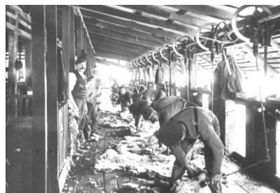
Equipo fijo de esquila en galpón.