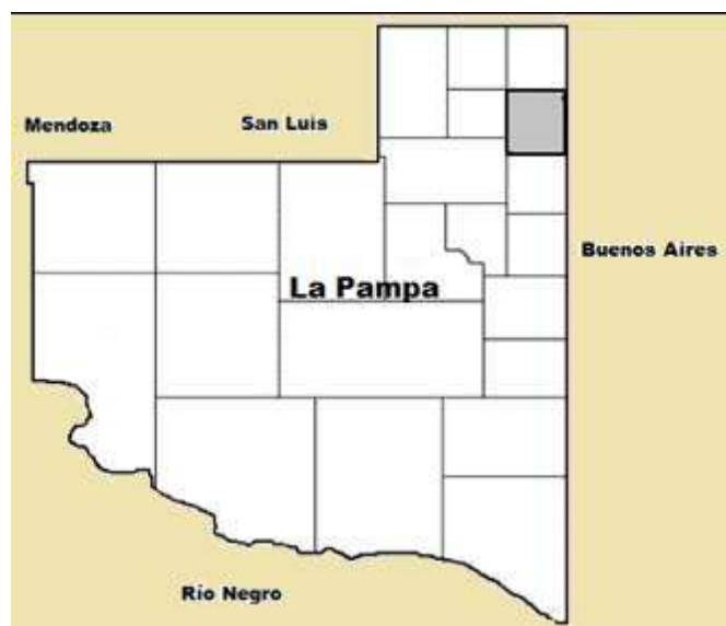
Figura N° 2. Mapa de la provincia de La Pampa. En gris, la ubicación del departamento Maracó.

El departamento Maracó se ubica al noreste de la provincia de La Pampa, limitando al este con la Provincia de Buenos Aires. El mismo es uno de los 22 departamentos que posee la provincia de La Pampa. Su cabecera es la localidad de General Pico. El clima de esta región es una variación del subtropical húmedo, también llamado templado, que se caracteriza porque la estación más cálida es también la más lluviosa; el promedio es de 750 mm anuales. Presenta veranos cálidos e inviernos frescos y variables, con heladas frecuentes pero sin nevadas. La temperatura media anual es de 17 grados, variando de los 15° C en el Sur a los 18° C promedio anual en el Norte.