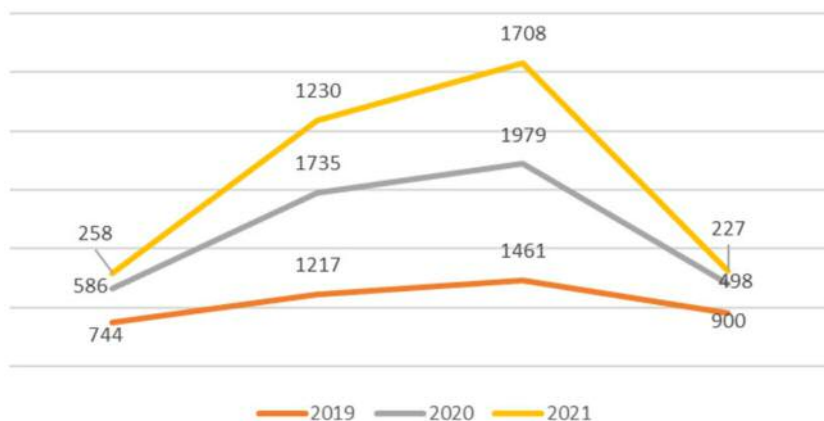
Figura 2. RCS de ovejas en lactancia con cordero al pie y (el último punto) con ordeñe a máquina durante 3 años.