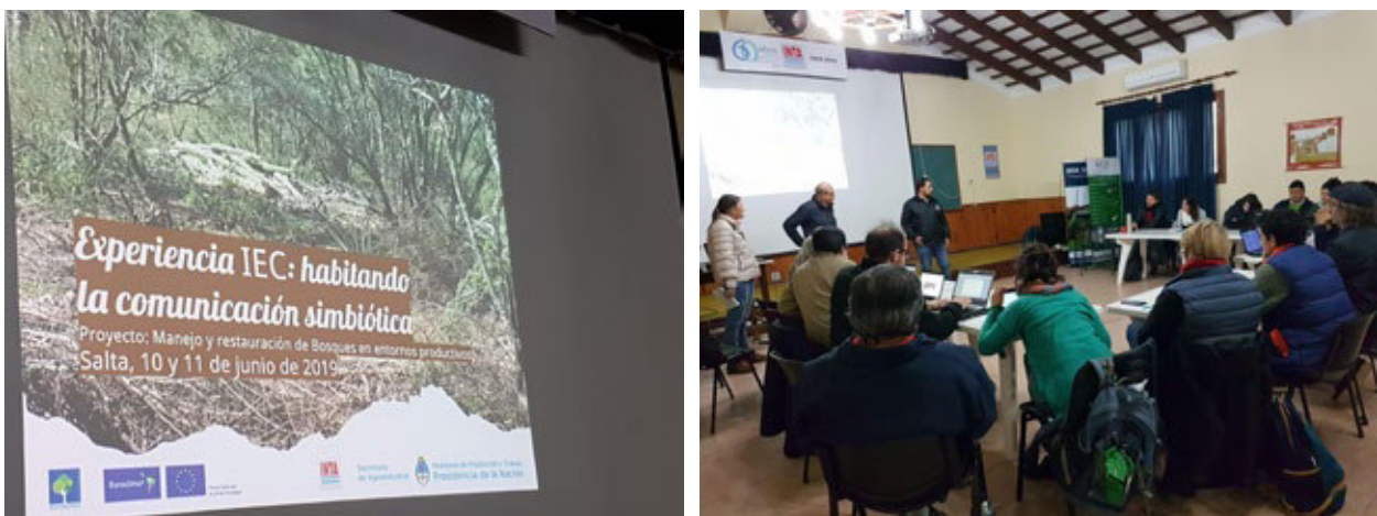
Imagen 1. Distintos momentos de la elaboración de la Versión Técnica Comunicacional

El 10 y 11 de junio de 2019 se concretó en el INTA Cerrillos, de la ciudad de Salta (Argentina) el taller “Experiencia IEC: habitando la comunicación simbiótica” con el objetivo de desplegar colectivamente la estrategia comunicacional del proyecto “Manejo sustentable de bosques en áreas productivas. Convocatoria: Euroclima+” (Imagen 1).