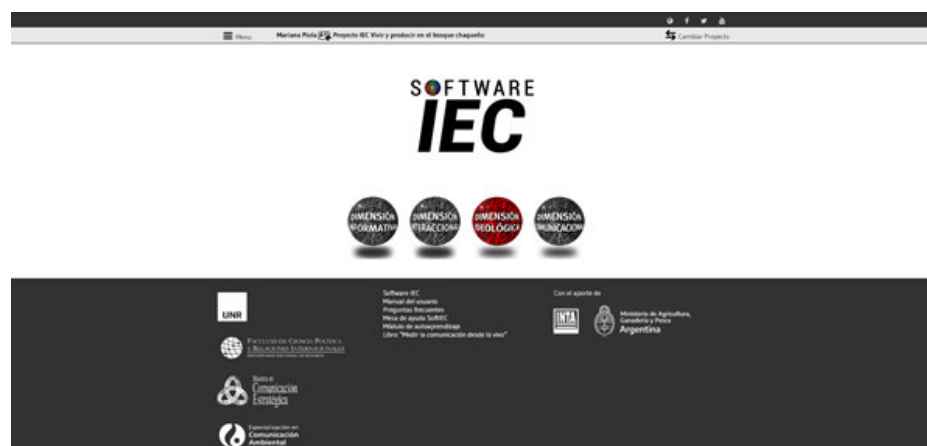
Imagen 5. Captura de pantalla inicial del Software IEC

El Software IEC es un modo de Gestión del Conocimiento a través de un tipo de medición multidimensional que aporta datos vinculados como una posibilidad de reflexión al interior de los equipos interdisciplinarios con la capacidad de reorientar la intervención de un modo más eficiente .