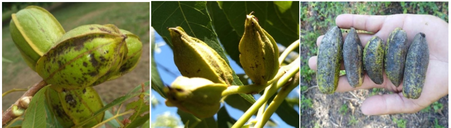
Síntomas de sarna en frutos de pecán de la zona de Bella Vista