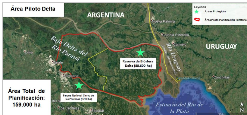
Figura 4. Bajo Delta - Área Piloto de Planificación Territorial y Áreas Protegidas.