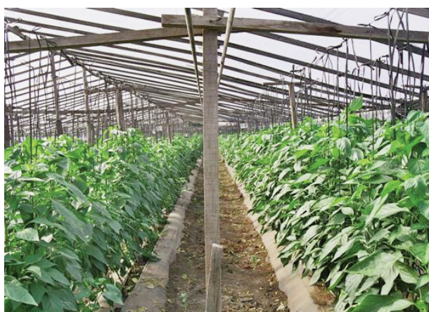
Figura 1. El ensayo se realizó en una quinta comercial de Colonia Urquiza, en el cinturón hortícola platense.

infección; el hongo crece entre las células del mesófilo y luego emite los conidióforos a través de los estomas en el envés de la hoja (BC Ministry, 2004). Durante una estación de cultivo pueden ocurrir varios ciclos de infección (Cerkaskas, 2004). Esta enfermedad se observa en condiciones de alta o baja temperatura (10 a 35 °C) y en climas secos o húmedos. Los conidios del hongo pueden germinar bajo cualquier condición de humedad relativa, aunque las condiciones óptimas son entre 85 y 95 % de HR y 15 a 25 °C de temperatura (Cerkaskas, 2004).