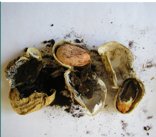
Síntomas de Carbón en maní

EL CONTROL MÁS EFICIENTE DE LAS ENFERMEDADES DEL SUELO ES LA PREVENCIÓN