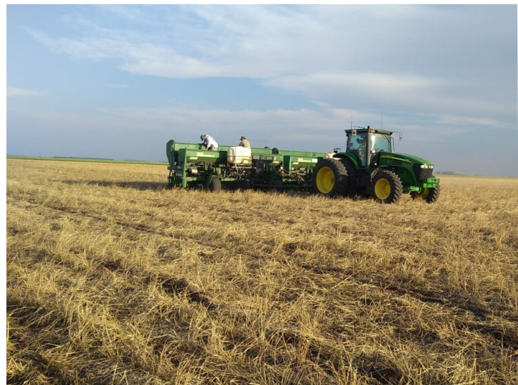
Siembra sobre cultivo de cobertura

crecimiento inicial de las plantas. La presencia de semillas de otros cultivares perjudica tanto el manejo agronómico como el valor comercial del producto cosechado.