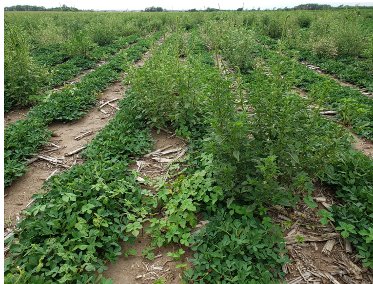
Lote de maní enmalezado