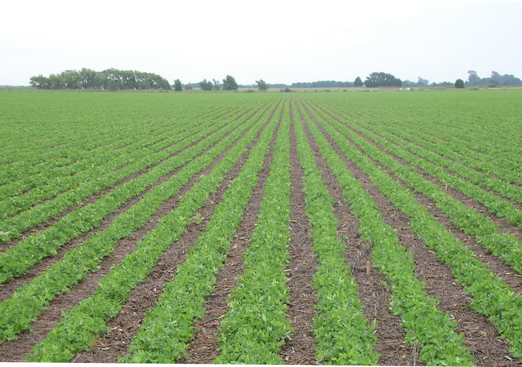
Cultivo de maní sobre rastrojo de soja