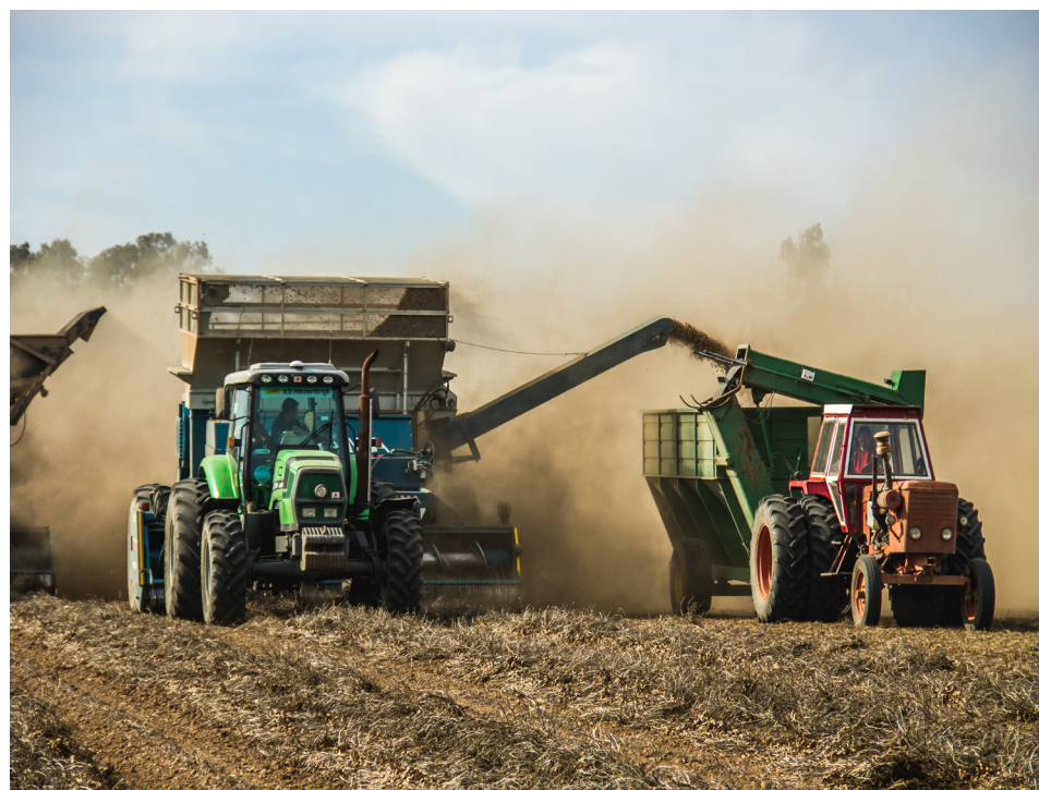
Descapotadora de doble hilera

El secado natural en el campo se realiza cuando las condiciones climáticas lo permiten. Para ello se requieren días con temperaturas elevadas, baja humedad relativa, vientos suaves y al menos una semana sin lluvias. Evidentemente que estas condiciones se dan sólo en determinadas épocas