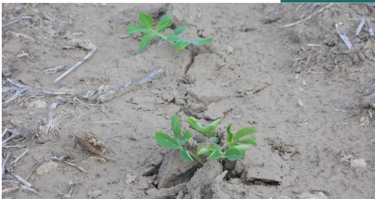
Nacimiento de maní en suelo encostrado

EN LA ROTACIÓN DE CULTIVOS, EL MANÍ DEBE INCLUIRSE CADA CUATRO AÑOS O MÁS.