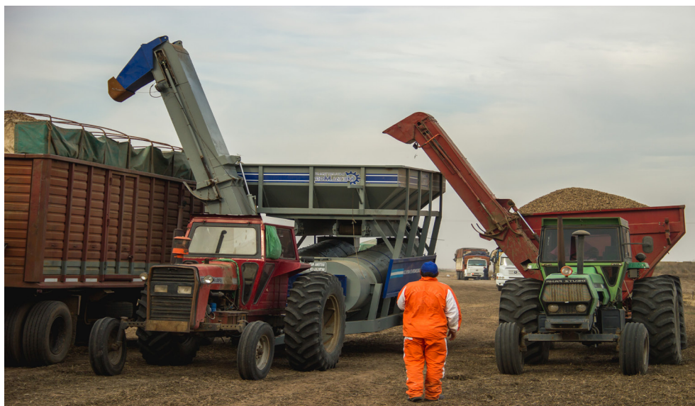
Prelimpieza en el campo

Cuando es necesario, el secado artificial debe comen-