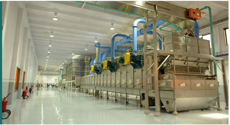
Sala de blandeado

EL MANÍ DEBE SER ALMACENADO EN VAINAS CON UNA HUMEDAD INFERIOR AL 10%