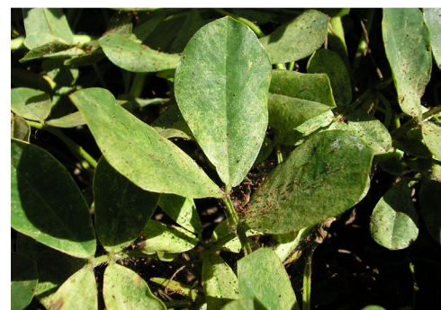
Arañuela sobre el cultivo

Los ataques más severos se producen en años cálidos y secos, cuando las arañuelas pueden completar una generación en 10-12 días, por lo que las