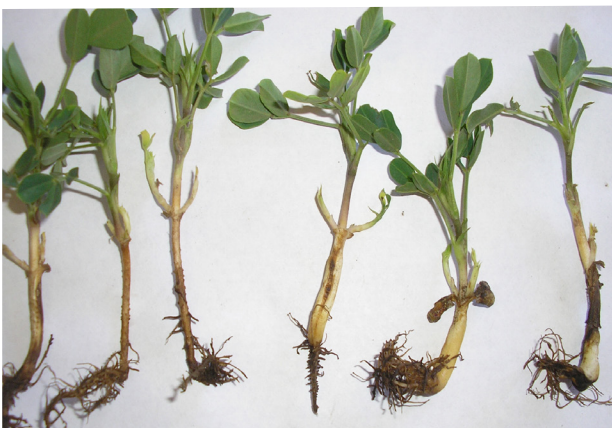
Plántulas con daños en raíces por hongos del suelo

Como consecuencia de la acción de estos organismos a nivel de raíz y cuello donde se inicia la infección, se observa en la parte aérea un marchitamiento total o parcial de las ramas, las que van adquiriendo una coloración