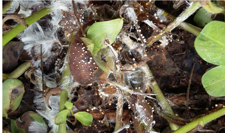
Muerte de plantas por complejo de hongos del suelo

castaña hasta que se produce la muerte de las plantas. Los daños causados por esta enfermedad se acentúan a medida que avanza el otoño manifestándose con mayor intensidad cuando las plantas se encuentran en el período de llenado de vainas (fines de febrero en adelante), produciendo la destrucción parcial o total de vainas y granos.