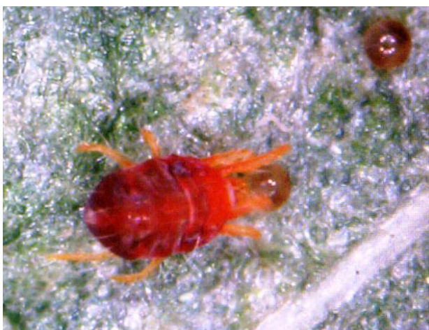
Arañuela adulta y huevos

Las arañuelas ( Tetranychus sp.) producen daños a la planta al succionar el contenido de las células desde el envés de las hojas. La presencia de arañuelas se observa en manchones dentro del lote, especialmente a lo largo de las cabeceras, mostrando las plantas un aspecto amarillento grisáceo. Cuando el ataque es intenso las plantas mueren. poblaciones se incrementan rápidamente y pueden pasar, en pocos días, de difícilmente observables a presencia abundante.