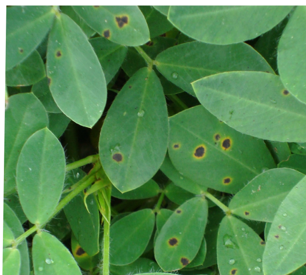
Intenso ataque de viruela tardía

La viruela temprana y la viruela tardía pueden ser identificadas por producir pequeñas manchas de color marrón, de un tamaño que oscila entre 2 a 4 mm de diámetro. La viruela temprana tiene generalmente un halo amarillento alrededor de la mancha, el cual también puede estar presente en la