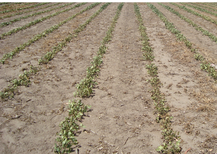
Sequía en primera etapa de crecimiento del maní

En el período de madurez del cultivo hasta cosecha las exigencias de agua son menores.