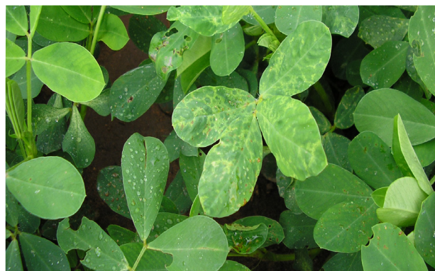
Hojas afectadas por trips

Las especies de trips encontradas con mayor frecuencia en la Provincia de Córdoba son Frankliniella schultzei y Caliothrips phaseoli . Son pequeños insectos que se alimentan de las flores y hojas en desarrollo a través de un "raspado" de la capa superior de la epidermis y succión del contenido celular. Además del daño producido en la hoja son transmisores de enfermedades. En general, no son un problema en cultivos de maní en Córdoba, pero en determinados años, con temperaturas bajas, sequías o daños