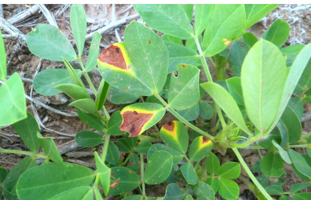
Hoja con síntoma de mancha en V

arachidicola. Los síntomas se presentan como parches difusos de color castaño con márgenes grisáceos. La forma en red de las manchas es característica en la cara superior de las hojas. Se la puede observar durante el otoño en períodos que predominan baja temperatura y elevada humedad relativa.