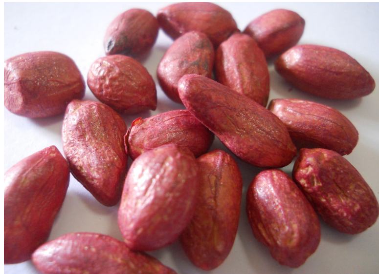
Semillas tratadas con polímeros

Son compatibles con todos los principio activo sin afectar la viabilidad de la semilla.