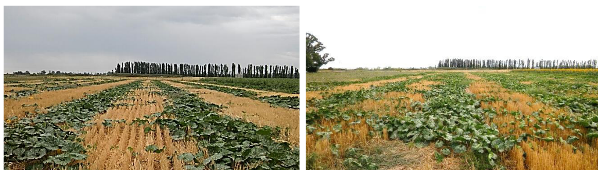
Figura 5: Diferentes momentos del ciclo del cultivo de zapallo donde puede observarse el avance en la cobertura de la superficie y la ausencia de malezas.

La densidad de malezas en la línea de cultivo de zapallo (L) fue de 3,12 pl/m 2 , mientras que en la entrelínea con rastrojo de trigo cosechado (EL) fue de 0,86 pl/m 2 . Estos valores se mantuvieron constantes hasta cosecha y no demandaron la aplicación de herbicidas considerando el escaso desarrollo de los individuos (Figura 5).