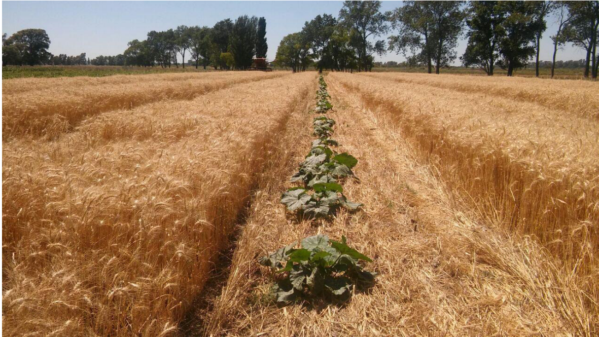
Figura 2: Avance del ciclo del cultivo de zapallo al momento de la madurez del cultivo de trigo.

Se empleó semilla del híbrido Tetsukabuto Sintosha, ( Cucurbita máxima x Cucurbita moschata ), del semillero GGCH, con 95% de poder germinativo y 99% de pureza. Como polinizador se empleó la variedad “plomo” ( Cucurbita máxima ) sembrado en las mismas condiciones sobre las dos bandas de trigo secado dispuestas hacia los lados del sitio experimental.