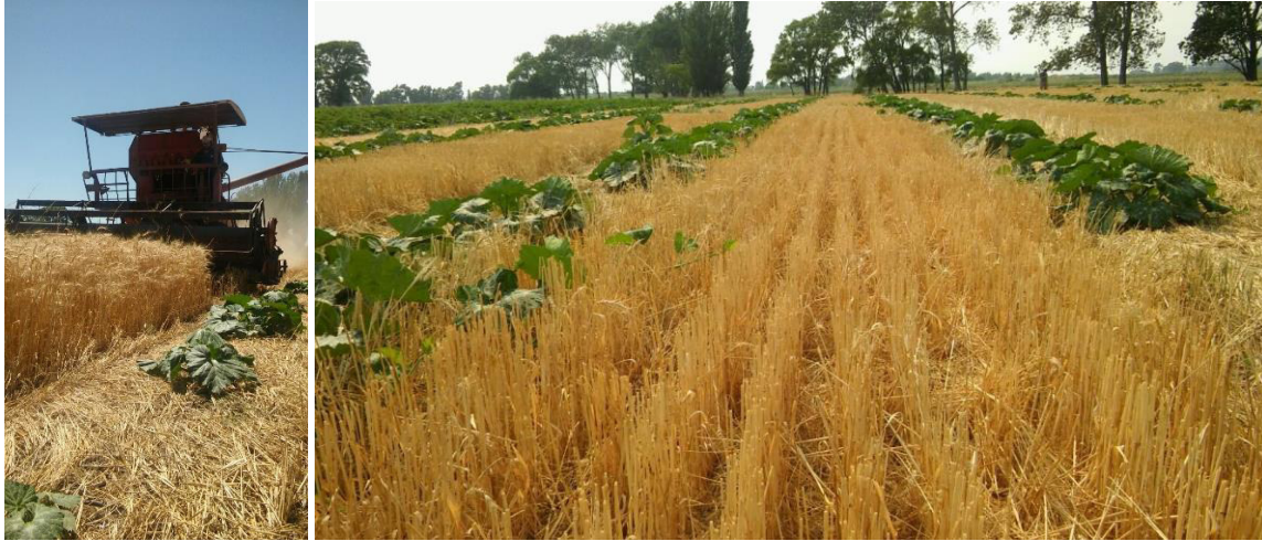
Figura 3: Izquierda: labor de cosecha de trigo. Derecha: estado del lote inmediatamente después de la cosecha de trigo.