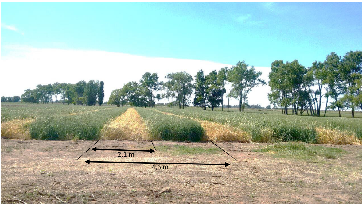
Figura 1: Distribución de las franjas de trigo secas destinadas a la posterior siembra directa de zapallo.

En 21 de octubre se realizó el secado de franjas de trigo en estado de espigazón mediante la aplicación de glifosato ( 3\ L\ ha^{-1} ) sobre bandas de 2,1 m de ancho equidistanciados 4,6 m entre sí (Figura 1). La aplicación se realizó con una pulverizadora montada con picos 0.15, de diseño abanico plano inducidos por aire, distanciados a 0,35m.