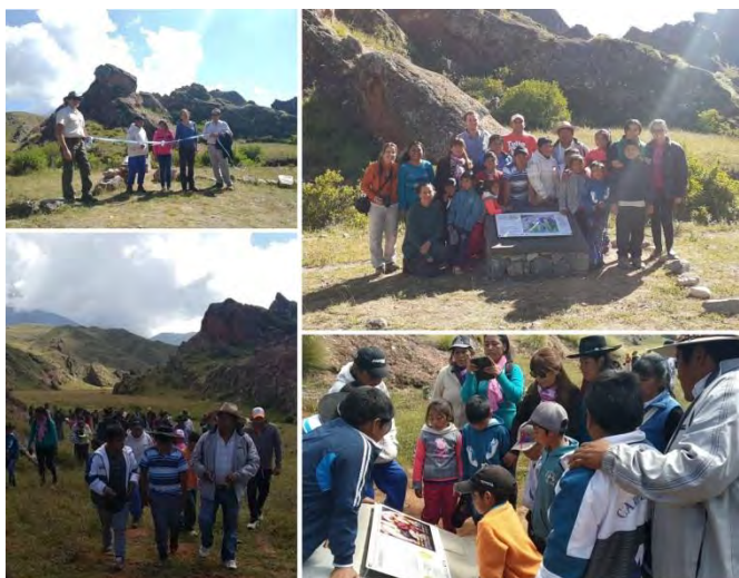
Inauguración del "Sendero de las Papas Silvestres" en Valle Encantado, PN Los Cardones (Marzo 2020)

Este aporte fue concebido entre las instituciones que forman parte de esta alianza, persiguiendo fortalecer el sentido de pertenencia e identidad de la comunidad local, generar un atractivo más para que sea disfrutado por los visitantes del PNLC y desarrollar y poner en práctica intervenciones de comunicación y educación que hagan que la conservación de la biodiversidad sea relevante en las estrategias nacionales orientadas al Desarrollo Sostenible.