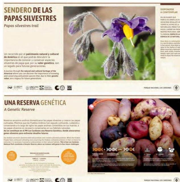
Dos carteles representativos del Sendero interpretativo y autoguiado instalado en el Valle Encantado, sitio emblemático del PNLC.

Todos estos esfuerzos para generar ámbitos de formación participativos, han producido hasta el momento avances imprescindibles. Uno de ellos, es el fortalecimiento del vínculo entre las instituciones que forman parte de esta alianza estratégica. Otro ejemplo es la inauguración en marzo de 2020 del “Sendero de las Papas Silvestres” en el Valle Encantado. El evento reunió a toda la comunidad vinculada con el Área Protegida: equipo de guardaparques, gestores y técnicos de APN, pobladores, estudiantes, maestros, profesores y padres de escuelas vinculadas al PNLC, pequeños agricultores de la zona de amortiguamiento y autoridades del municipio de Payogasta.