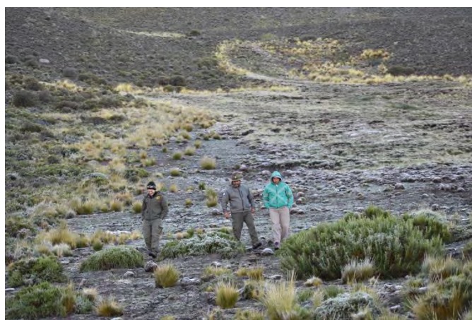
Prospección y recolección, imagen representativa de una instancia indispensable de inter-aprendizaje sobre las que se sustenta el proyecto de Reservas Genéticas en APs de la Argentina.

trasladó a Mendoza (Instituto de Biología Agrícola de Mendoza, IBAM-CONICET/UNCuyo) y a Balcarce (Unidad Integrada Balcarce-UIB, EEA Balcarce INTA/FCA-UNMdPlata) para su estudio y evaluación.