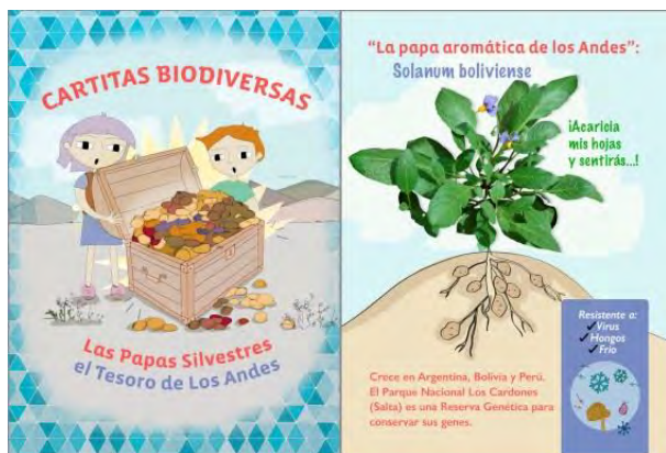
Cartitas Biodiversas, uno de los recursos didácticos y de divulgación desarrollados para trabajar en Talleres de Educación Ambiental.

Estas actividades de socialización fueron potenciándose con la maduración del proyecto. Así surgió en la última Campaña el Taller de Educación Ambiental y Cultivos Andinos dictado en la Escuela 4596 de Isonza “Martín Miguel Juan de la Mata Güemes”. Aquí, se identificaron aspectos que merecen ser subrayados: i) la excelente predisposición de la comunidad educativa, pobladores, agricultores y agentes del PNLC para acompañar la iniciativa, ii) el conocimiento de los estudiantes de primaria y secundaria de la flora silvestre de su entorno y de la importancia de la conservación de la biodiversidad, iii) el diseño e implementación de actividades prácticas y lúdicas para cumplir con los objetivos presentados anteriormente, iv) la confianza que tiene la comunidad educativa en el equipo de guardaparques y gestores del PNLC.