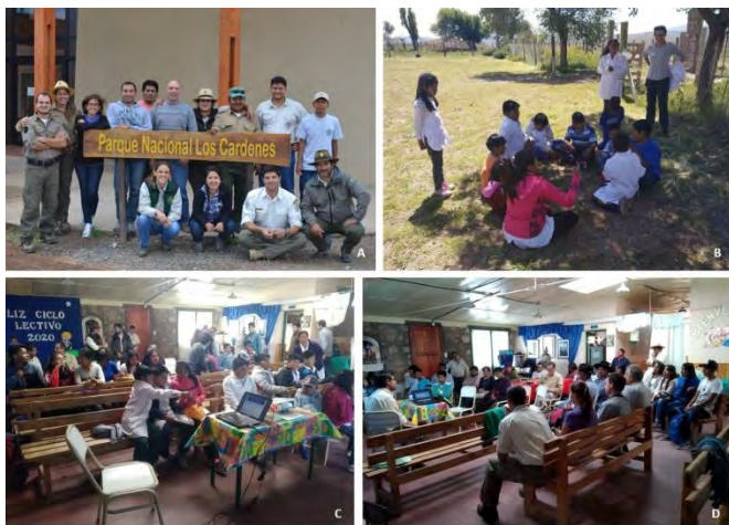
A. Primer Taller de Educación Ambiental desarrollado en la Intendencia del PNLC (2017). B, C y D. Tercer Taller de Educación Ambiental y Mesa redonda: “El Parque Nacional Los Cardones y los cultivos andinos”, desarrollados en la escuela de Isonza (2020).

Estas actividades de socialización fueron potenciándose con la maduración del proyecto. Así surgió en la última Campaña el Taller de Educación Ambiental y Cultivos Andinos dictado en la Escuela 4596 de Isonza “Martín Miguel Juan de la Mata Güemes”. Aquí, se identificaron aspectos que merecen ser subrayados: i) la excelente predisposición de la comunidad educativa, pobladores, agricultores y agentes del PNLC para acompañar la iniciativa, ii) el conocimiento de los estudiantes de primaria y secundaria de la flora silvestre de su entorno y de la importancia de la conservación de la biodiversidad, iii) el diseño e implementación de actividades prácticas y lúdicas para cumplir con los objetivos presentados anteriormente, iv) la confianza que tiene la comunidad educativa en el equipo de guardaparques y gestores del PNLC.