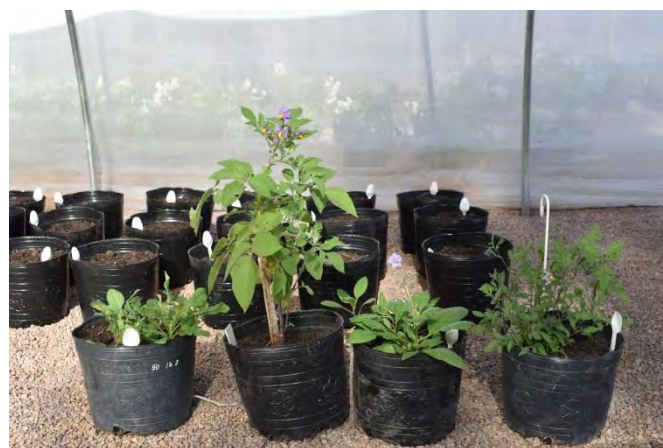
Colección establecida en el IBAM con germoplasma silvestre de papa recolectado en el PN Los Cardones. De izquierda a derecha: Solanum acaule , S. vernei , S. boliviense y S. brevicaulle .

Con el conocimiento generado pretendemos desarrollar programas de monitoreo sustentados en una base ecológica y genética sólida para la conservación in situ de este germoplasma en el PNLC.