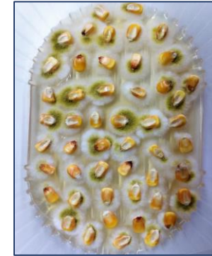
Figura 1. Granos de maíz con crecimiento fúngico en medio DG18.