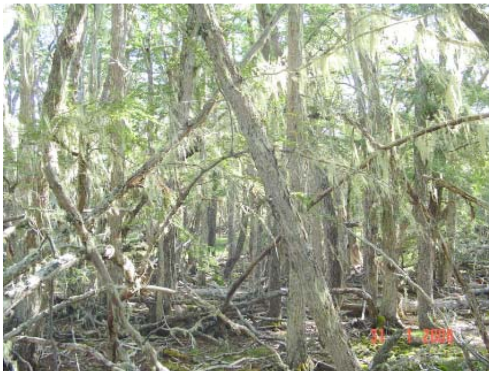
Figura 1. Rodal donde predominan árboles maduros de ñire (más de 100 años de edad, con la corteza rugosa y agrietada) con densidad de 300 a 500 árboles/ha.

niente distinguir los rodales (unidades de bosque homogéneos) que constituyen la masa boscosa y su correspondiente superficie (en hectáreas) para optimizar el número de parcelas a realizar. Si no se cuenta con información previa que permita distinguir rodales, se deberá considerar a la masa boscosa como heterogénea.