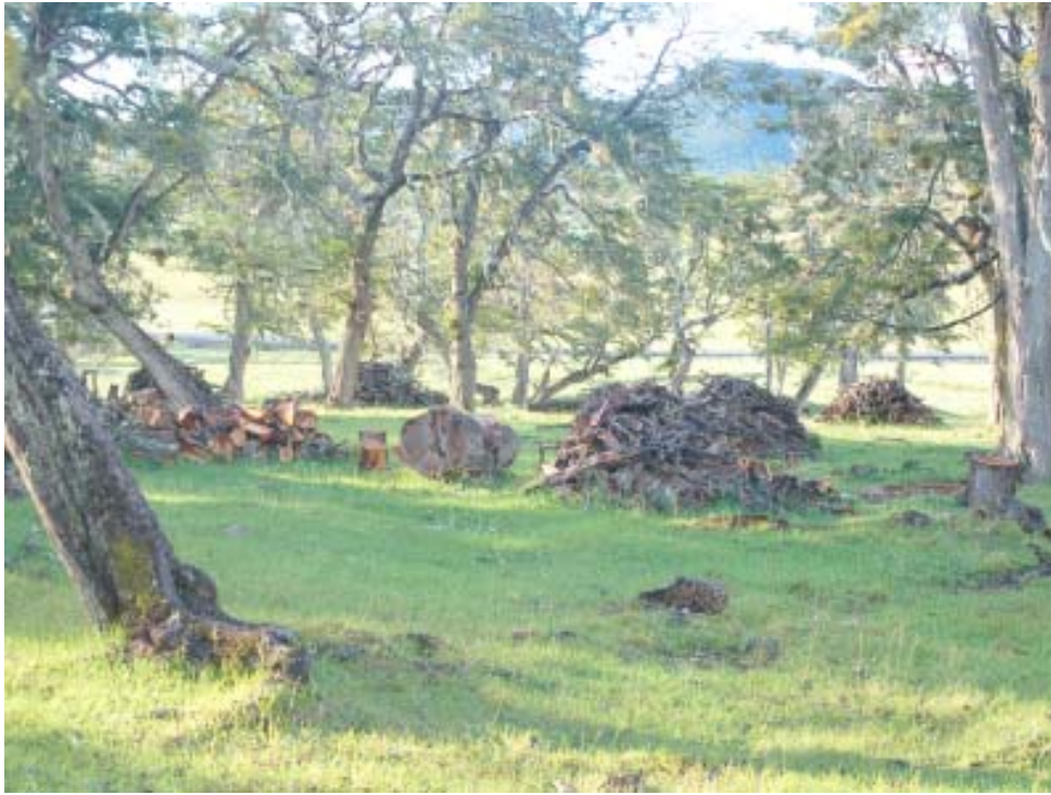
Figura 2. Rodal donde predominan árboles maduros de ñire (más de 100 años de edad, con la corteza rugosa y agrietada) intervenido anteriormente o abierto con densidad de 80 a 200 árboles/ha

El área de influencia de cada parcela donde se efectúan las mediciones de clase de sitio (CS), cobertura de copas (CC) y cantidad de residuos leñosos (R) será de 1.000 m 2 (Figura 4).