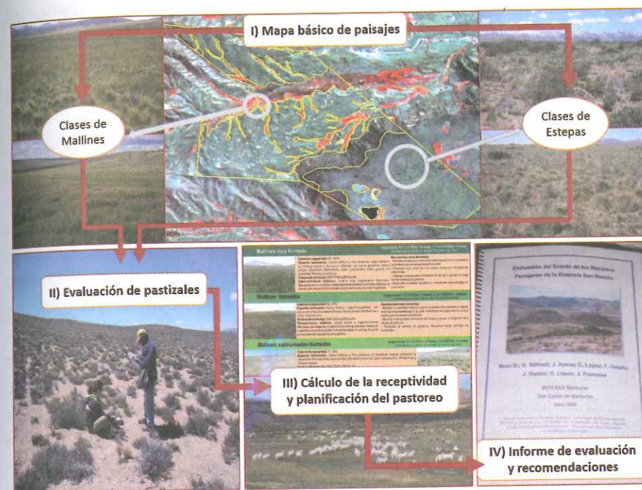
Figura 4. Etapas de la evaluación forrajera de establecimientos.

Velazco y Siffredi, 2013); Guía de evaluación del grado de uso de pastizales (Siffredi, 2012), planillas de campo para la evaluación forrajera de estepas y mallines.