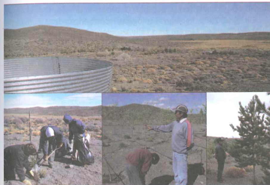
Figura 7. Distintas etapas de la instalación de montes leñeros al sur de Río Negro.

Mantenimiento: Antes del año de plantación se deberán evaluar prendimientos y si fuera necesario reponer árboles y arbustos muertos. Todos los años revisar los sistemas de riego de manera de asegurar un caudal adecuado. Realizar una poda de mantenimiento y de limpieza de las ramas de los árboles.