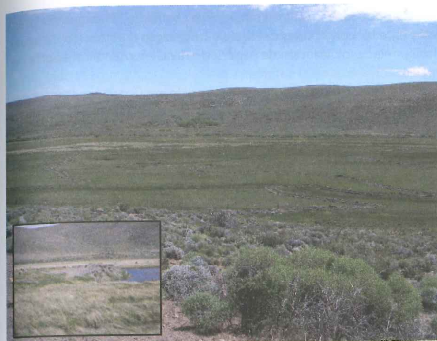
Figura 5. Construcción de terraplenes y canales para la restauración hidrológica de mallines.

Es necesario solicitar a la autoridad regulatoria del agua de la provincia, el Departamento Provincial de Aguas, el permiso correspondiente de uso de agua pública antes de realizar las obras.