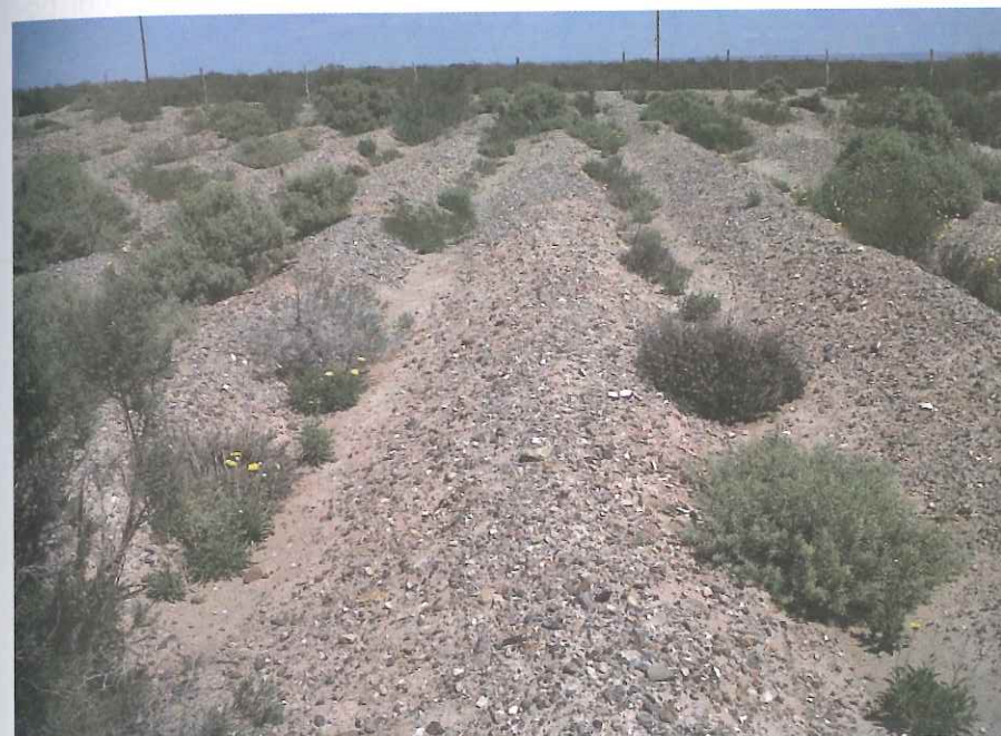
Figura 6. Revegetación con arbustos en área degradada por explotación petrolera.

Mantenimiento: Un año luego de la fecha de trasplante, se procura una visita para evaluar el grado de éxito de la implantación (Fig. 6).