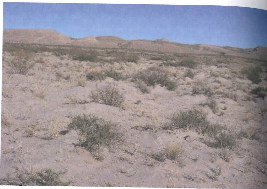
Figura 2. Erosión eólica. Montículos y nebkas.

erosión en forma de barrido que nacen en las escarpas de erosión en el sector Norte de la Meseta de Somuncurá y los campos de médanos originados en la costa Norte del golfo San Matías (Rostagno et al. , 2004).