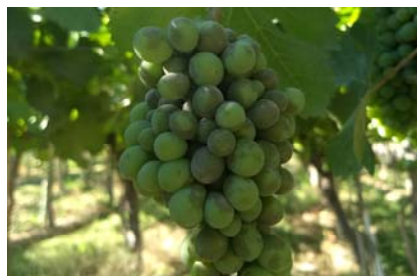
Fig.1. Síntoma y signo del oidio de la vid en racimo, cv. Chenin.

Laboratorio: se analizó a cosecha en racimos recolectados del T2 residuos de trifloxistrobin y tebuconazole. La extracción fue por el método QuEChERS y el análisis por UPLC-MS/MS