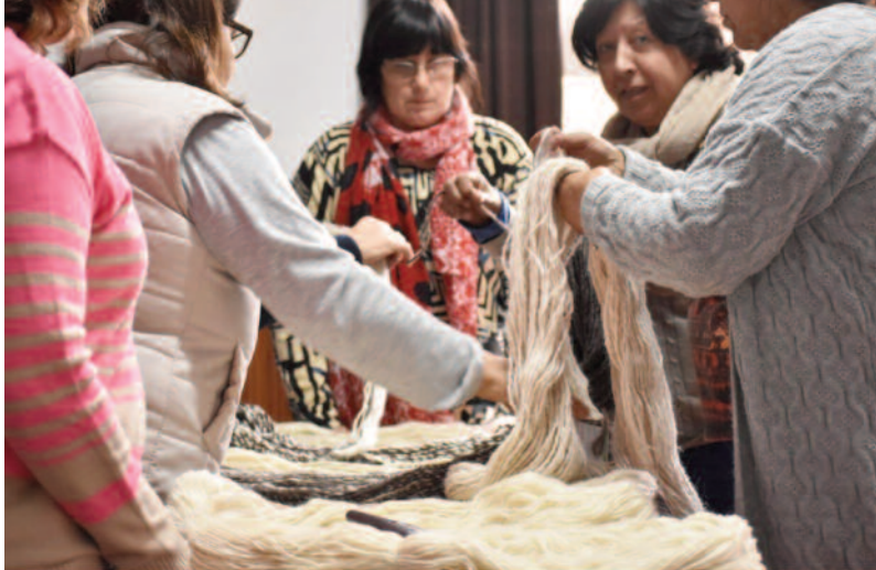
Las artesanas de SUMA evalúan la calidad del hilado artesanal en base al protocolo de INTA.

El objetivo inicial del proyecto, fue generar ingresos para la familia, pero se ha avanzado mucho más allá. Permitted abordar la igualdad de géneros al convertirse en un espacio de empoderamiento para un grupo de mujeres, que de este modo ganaron en autonomía personal y económica y superaron roles históricamente esta-