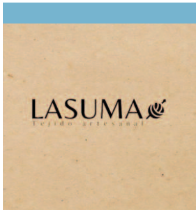
Logo de LASUMA construido colaborativamente con la asistencia técnica de INTA/Diseño.