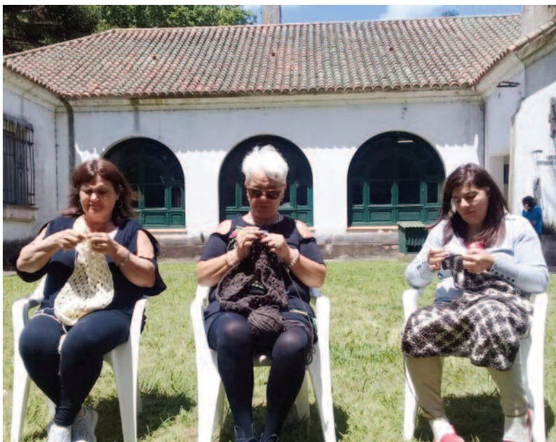
Hilanderas de LASUMA en actividad práctica durante una capacitación con INTA/Diseño en el CECAIN de

blecidos. Además, se convirtieron en un emprendimiento capaz de sostenerse en el tiempo, favoreciendo el arraigo de las familias en el medio rural