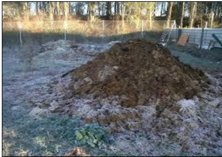
Figura 1 – Pila de estiércol fresco quemándose por exceso de aireación o secado

Lo ideal es disponer de termómetros con sondas para controlar que la temperatura llegue a 55 °C durante los primeros 15 días. Si esto ocurre la "higienización" del estiércol estará garantizada. Como no todas las capas logran la misma temperatura la pila debe ser volteada para mezclarlas.