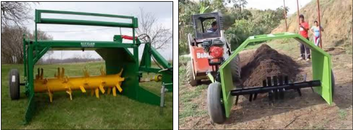
Figura 4 – Equipos de tracción para el volteo de pilas de estiércol

Si le estiércol está muy compactado y seco los microorganismos demorarán para iniciar su trabajo, por lo que se aconseja tritararlo con rastra o arado rotativo ("rotavator"). Existen equipos mecánicos específicos para el volteo de pilas de estiércol, como lo muestra la Figura 4.