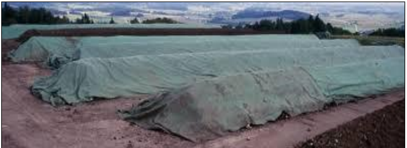
Figura 5 – Pilas de estiércol madurándose bajo cubierta de tela media sombra

Es muy conveniente cubrir la pila para evitar lavados por lluvia o evitar secado excesivo. Esto se puede realizar con tejidos media sombra (Figura 5), de manera tal que evite el lavado de lluvias intensas y evite parcialmente la evaporación, conservando la humedad. No es conveniente tapar con polietileno ya que la falta de oxígeno y el exceso de humedad provocarán fermentaciones indeseables.