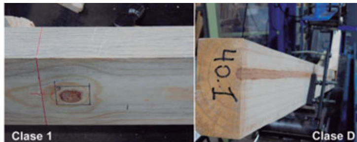
Figura 3. Tablas de pino ponderosa de la mejor calidad estructural y de calidad no-estructural. La tabla de clase 1 tiene nudos individuales menores a 1/3 del ancho de su cara, mientras que en la tabla de la clase D se observa la presencia de médula y los anillos de crecimiento de gran grosor.

Presenta todas las disposiciones y requisitos relativos al comportamiento mecánico de las estruc-