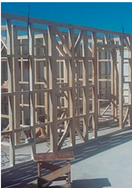
Figura 1. Sistema constructivo de entramado en madera.

El pino ponderosa es la especie más forestada en Patagonia Norte con alrededor de 96 mil hectáreas implantadas en Neuquén, Río Negro y Chubut. Luego de cuatro años de trabajo conjunto entre instituciones del ámbito