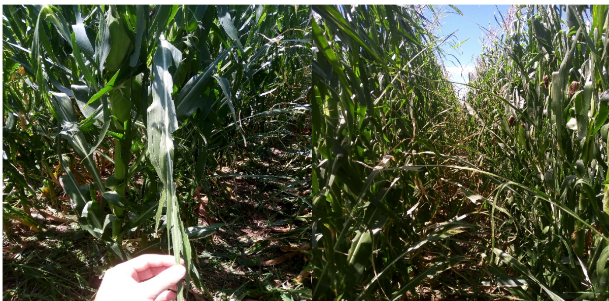
Imagen 1: Daño en hojas ocasionado por granizo

La alta pluviometría de enero fue acompañada por un evento de granizo (14/01/21) que afecto fuertemente el área foliar del cultivo como se puede ver en las imágenes 1 y 2.