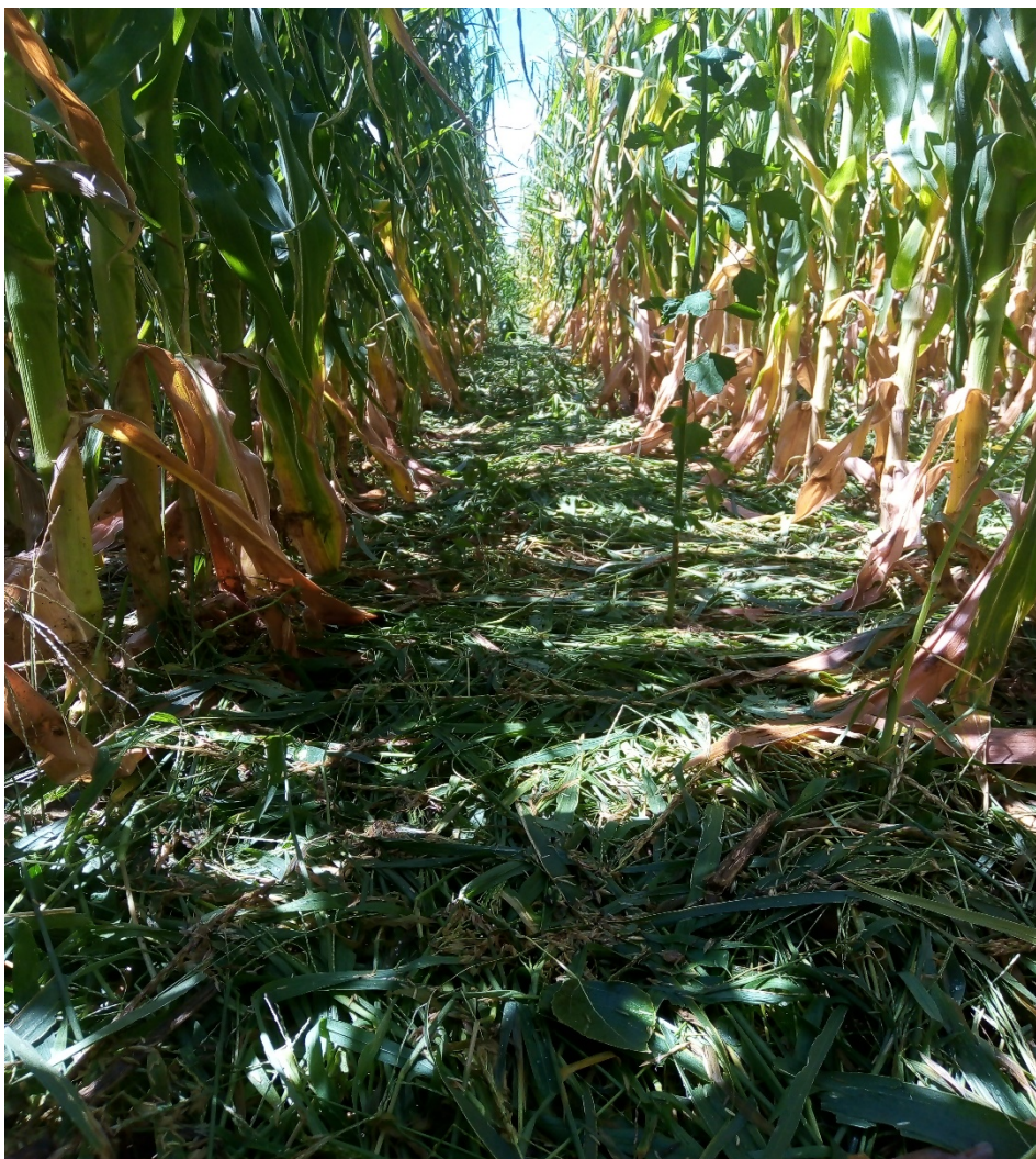
Imagen 2: Hojas dañadas sobre el suelo, producto de la caída de granizo.

Plagas y enfermedades: No hubo presencia de enfermedades ni plagas durante el ciclo del cultivo.