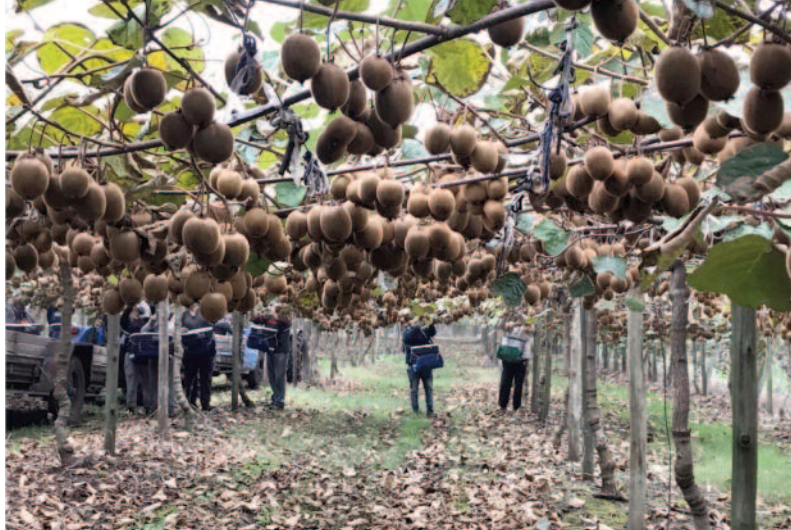
Operarios de cosecha con protección ocular y barbijo.

Esta iniciativa de asociativismo para la exportación es muy destacable, consecuencia de una relación madura entre los productores, y marca el inicio de un crecimiento de este canal de comercialización que sin dudas requie-