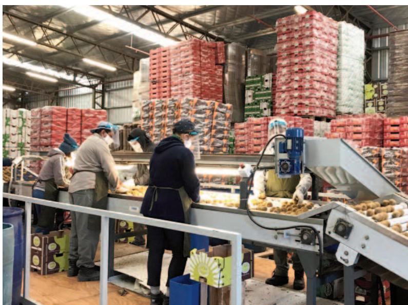
Proceso de selección en la línea de empaque aplicando medidas de protección.