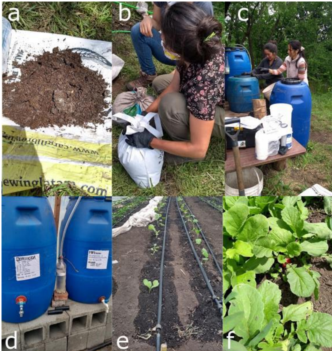
Figura 4. Preparación y uso de MM líquido a partir de MM sólido Extraído de: Cardozo, A; El Mujtar, V; Alvarez, V. 2020. Cartilla “Elaboración de Biofertilizantes a partir de microorganismos del bosque. INTA. Proyecto FONTAGRO ATN/RF-16680-RG.

Una vez preparado el MM líquido se puede aplicar como biofertilizante en los cultivos. En hortalizas, se puede aplicar semanalmente. La dosis varía según el tipo de aplicación. Para aplicar al suelo usar en dilución al 30%, en tanto que para aplicar al cultivo (vía foliar) se debe usar en dilución al 20% (Figura 3d-e). También puede aplicarse para el control de hongos patógenos. En este caso la aplicación es directamente en el suelo (en dilución 50% o puro).