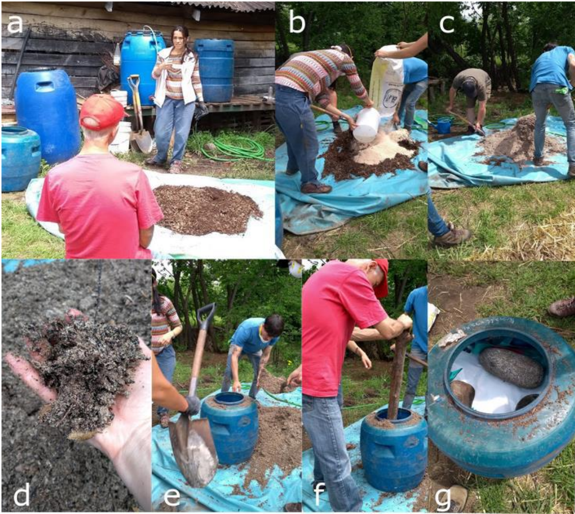
Figura 3. Preparación de MM sólido. Extraído de: Cardozo, A; El Mujtar, V; Alvarez, V. 2020. Cartilla “Elaboración de Biofertilizantes a partir de microorganismos del bosque. INTA. Proyecto FONTAGRO ATN/RF-16680-RG.

Se agregan 8-10kg de MM sólido a la bolsa, se cierra bien la bolsa y se introduce en el tambor con 200 litros de agua con el azúcar (Figura 3a-c). Tapar el tambor, usando tapa con sistema de captura de gases (CO 2 ). El tambor debe quedar bajo sombra por unos 15 días.