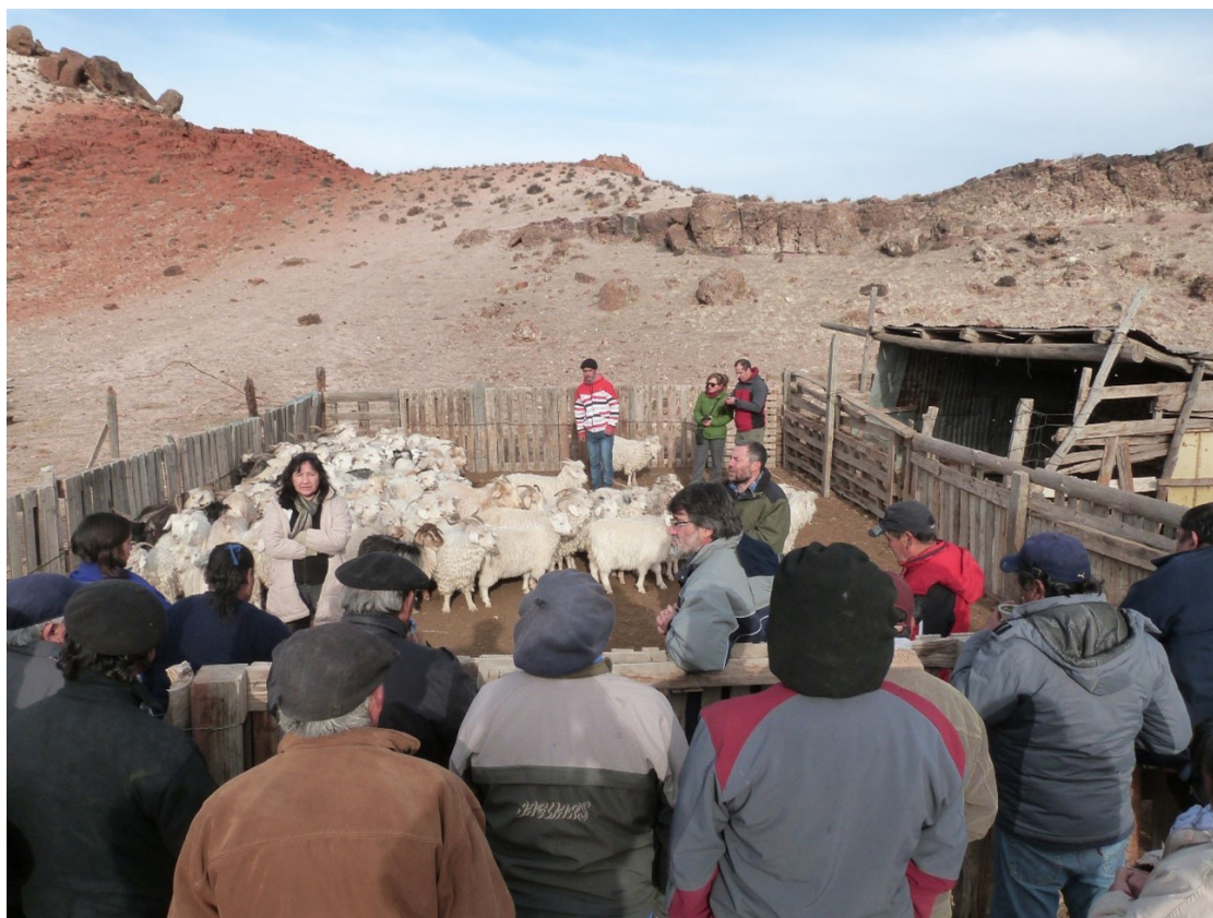
FIGURA 4 – Taller de peinado de cabras Cabras Criollas Neuquinas (Comallo, Río Negro, Patagonia Argentina- 2017).