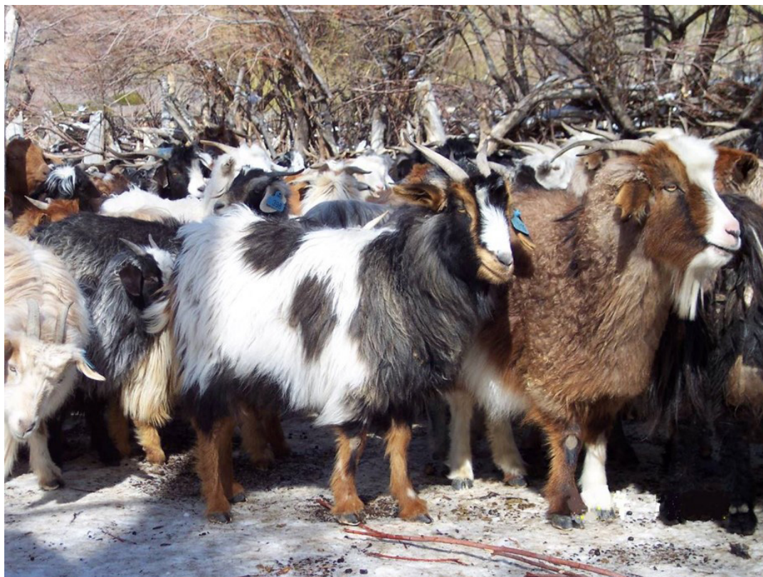
FIGURA 2 – Cabras Criollas Neuquinas.

se concentró en la región Línea Sur, que comprende casi la mitad de la superficie del sur de la provincia de Río Negro, y se encuentra distribuida en seis departamentos: 9 de Julio, Valcheta, Pilcaniyeu, 25 de Mayo, Ñorquinco y El Cuy (Figura 3).