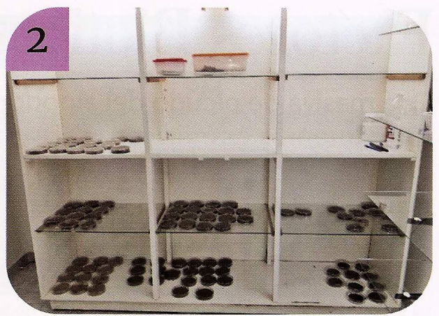
Figuras 1 y 2. Cría masiva del picudo del algodón en laboratorio: 1) cápsulas de petri con dieta y emergencia de adultos, junto a larvas y pupas; 2) Cámara de cría de insectos INTA Reconquista.