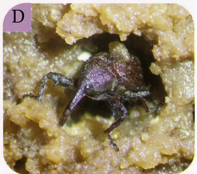
Figura 3. Estadios del picudo algodón: a) Huevos de picudos en proceso de limpieza; b) Larva, c) pupa, d) adulto