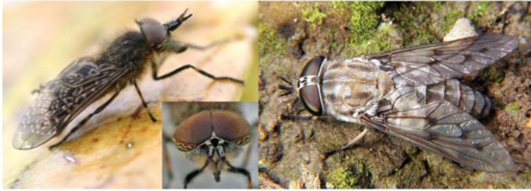
Figura 1: Detalle de la cabeza del tábano. Izquierda macho sin separación entre los ojos; derecha, hembra donde se observa dicha separación.