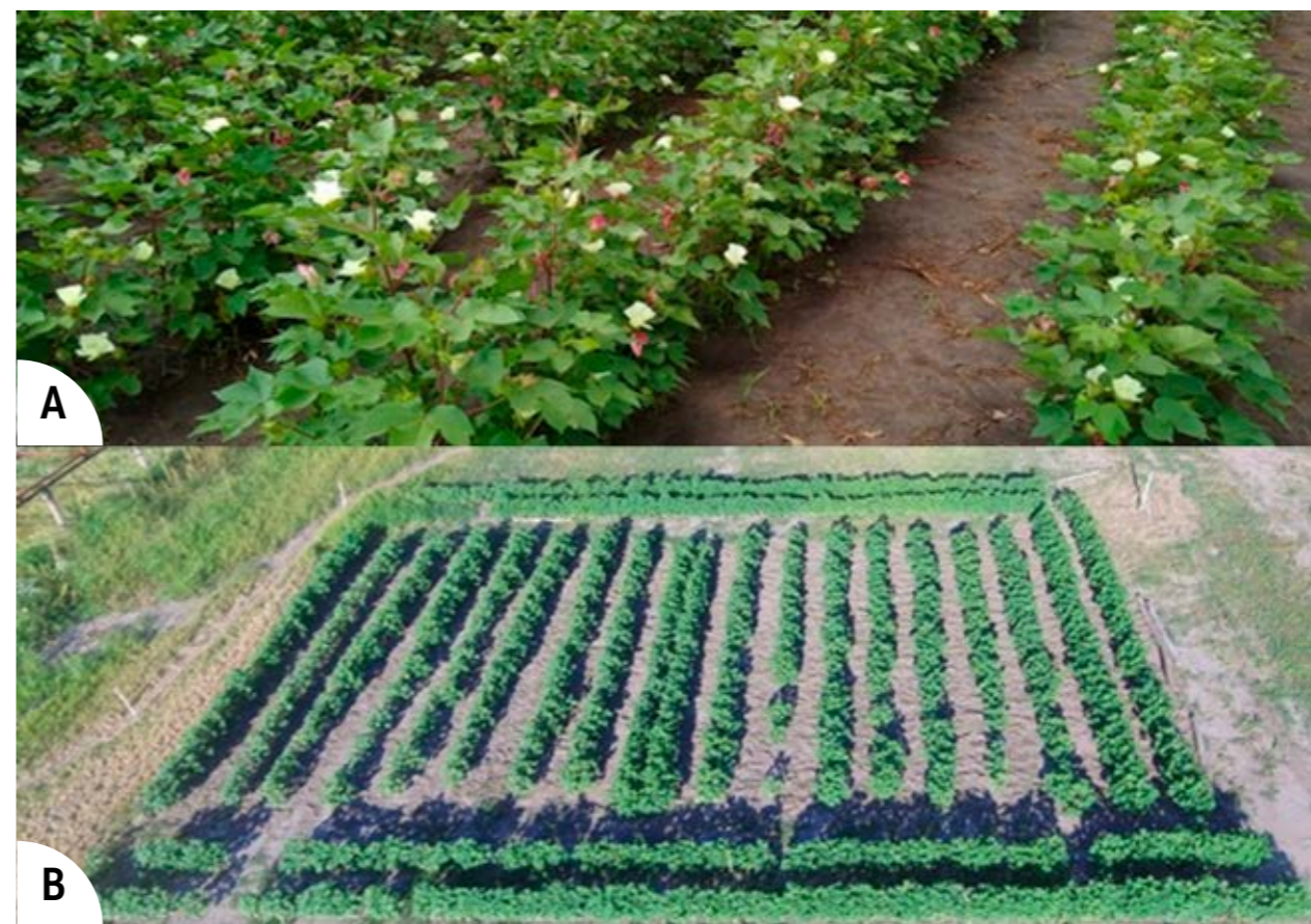
Figura 2: Población segregante F 2 . Imagen A mostrando el detalle del distanciamiento y distribución de las plantas (líneas distanciadas a metro, con distanciamiento de planta a 20 cm); Imagen B mostrando una foto aérea.

compuesta por aproximadamente 200 plantas, será utilizada como población de mapeo y es en la cual se realizaron las siguientes mediciones: i) Rendimiento bruto: se recolectó la fibra de algodón de todas las cápsulas presentes en las plantas y se pesaron en balanzas de precisión; ii) % de desmote: se tomó toda la fibra de algodón proveniente de las mediciones de rendimiento bruto y se realizó el desmote en una mini-desmotadora experimental. Luego del desmote, se pesó la fibra y semillas por separado en una balanza de precisión. El porcentaje de desmote es la relación entre el peso de la fibra sobre el peso de la fibra más la semilla; iii) Parámetros de calidad tecnológica de fibra de algodón: para obtener estos parámetros se enviaron las muestras de fibra de algodón, obtenidas luego del desmote al laboratorio de HVI (USTER 1000) que posee APPA en las instalaciones del parque industrial de Reconquista, Santa Fe. Los parámetros de calidad tecnológica de fibra evaluados fueron: longitud promedio de la mitad superior (UHML), Micronaire y resistencia de fibra (g.tex -1 ). La población segregante generada es utilizada para identificar y validar marcadores moleculares relacionados a características de interés agronómico, los que posteriormente serán utilizados en el proceso de selección. Cabe aclarar que además de la F 2 , se incluyeron en la siembra a campo las F 1 y las líneas parentales con el fin de lograr un análisis global de las características heredadas de los cruzamientos.