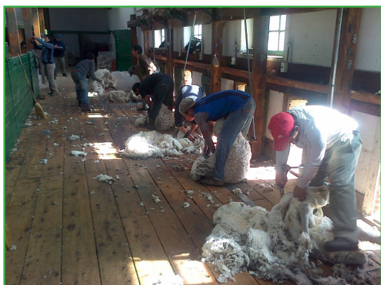
Figura 1: Esquila de ovinos Merino realizada por empresa de esquila habilitada (PROLANA).

En los sistemas de producción ovina, la elección del momento de esquila es una de las decisiones de manejo más importante, por sus múltiples consecuencias productivas y económicas. Tradicionalmente, la esquila (Figura 1) se ha realizado en fechas posteriores a la época de partos, en condiciones ambientales más benévolas durante fines de primavera y principios del verano.