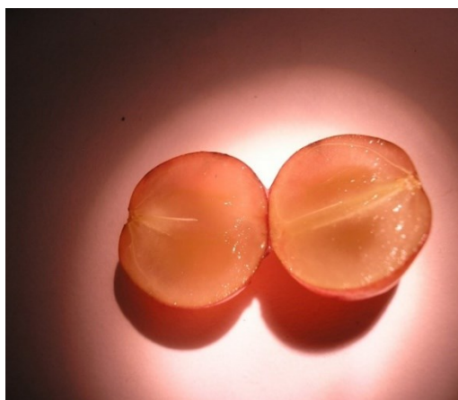
Figura 23. Corte longitudinal de baya de Flame Seedless sin rudimento seminal.