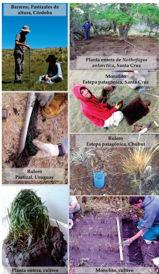
Figura 2. Métodos de muestreo empleados en distintas regiones de la Argentina y de Uruguay para obtener la fracción vegetal subterránea en sistemas naturales y en cultivos.

La elección del método de muestreo y el diseño experimental parecería estar basada en los métodos empleados previamente en el sistema de estudio de cada grupo de investigación. Es posible que esta decisión se relacione con la posibilidad de obtener resultados comparables, además de que el método esté avalado por trabajos científicos anteriores. Si bien se podría considerar que la asignación aleatoria de las parcelas de muestreo resulta más sencilla en sistemas de pastizales que en arbustales, estepas o bosques, la mayoría de las investigaciones ubican las parcelas de manera sistemática en todos los ecosistemas. La cercanía y el tamaño de los individuos parecería ser determinante tanto para muestrear cerca (e.g., bosques, arbustales, estepas) o lejos de ellos (e.g., pastizales, estepas). Por otra parte, aunque se conoce que el período del año de máxima productividad de raíces puede no coincidir con el de la productividad aérea, tal como ha sido registrado en la estepa patagónica (Soriano et al. 1987) y en pastizales (López-Mársico et al.