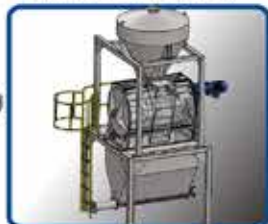
· MEZCLADORA PALETA