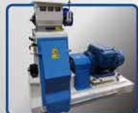
· SISTEMAS DE MOLIENDA HORIZONTAL