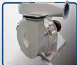
· MOLINO MICRONIZADOR SIN MARTILLO

» UNA EMPRESA DEDICADA AL CRECIMIENTO DE LA INDUSTRIA.