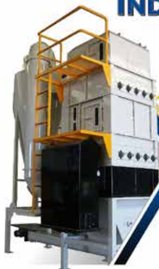
· SECADORES VERTICALES LINEA SV