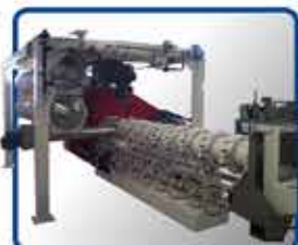
· EXTRUSOR MONOTORNILLO LINEA HU