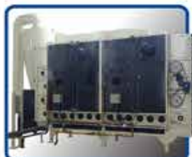
· SECADOR HORIZONTAL LINEA SH