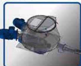
· MEZCLADORA TURBINA