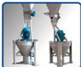
· SISTEMAS DE MOLIENDA VERTICAL