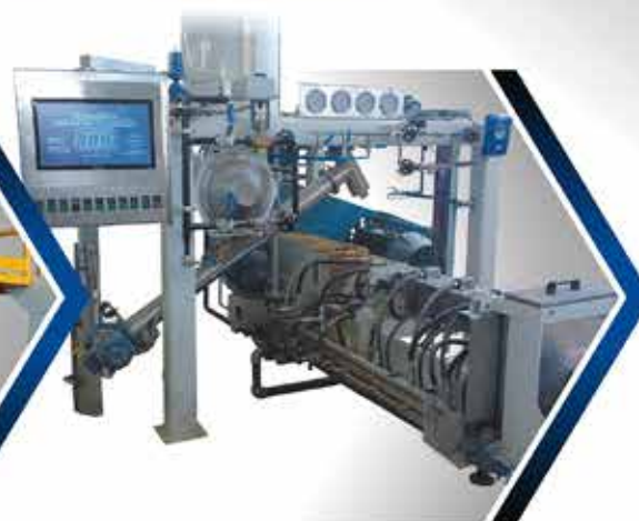
· EXTRUSOR DOBLE TORNILLO CORROTANTE LINEA DT