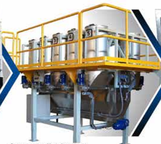
· DOSIFICADORES DE MICRO INGREDIENTES