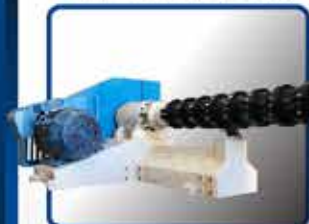
· EXTRUSOR MONOTORNILLO LINEA S