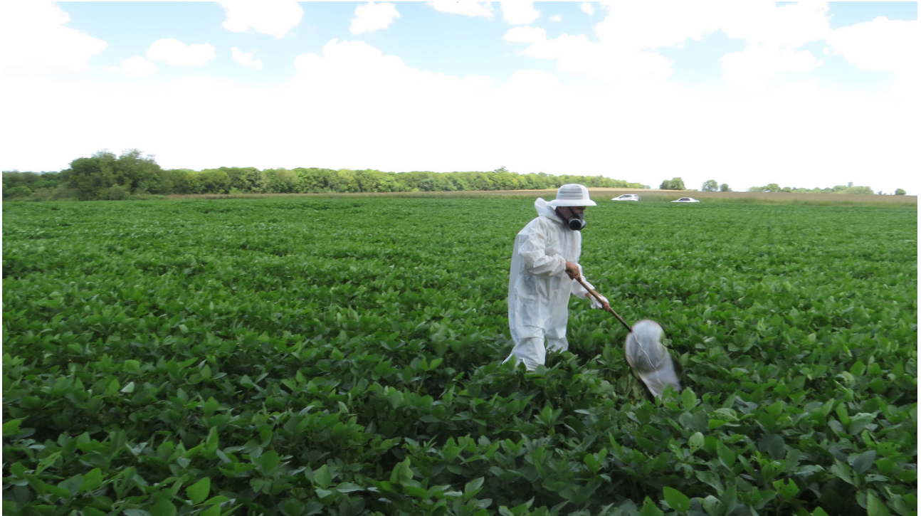
Figura 1. Capturas de artrópodos en canopia de cultivo con red entomológica.