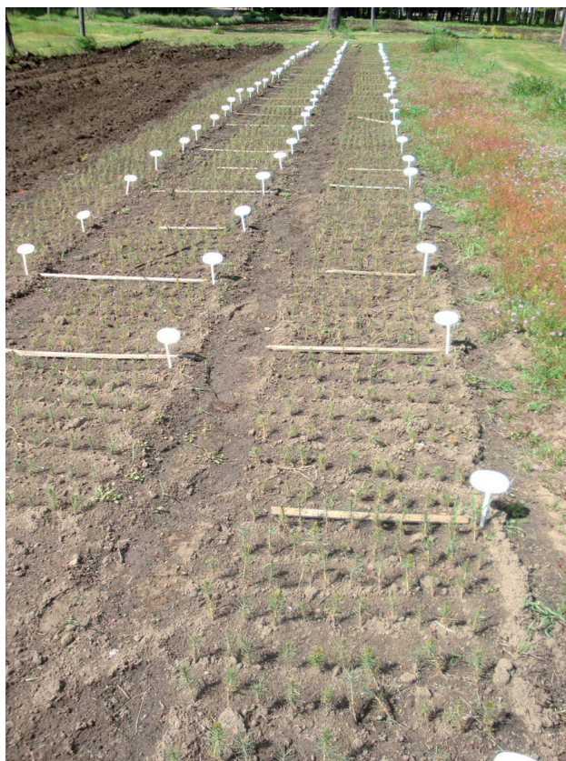
Figura 1. Ensayo de APS de Pino Ponderosa establecido en el Campo Forestal Gral. San Martín del INTA, en Las Golondrinas. Plantas recién repicadas, con 1 año de edad.

En Trevelin la siembra se realizó en 7 surcos longitudinales al almácigo, separados entre sí unos 15 cm. Ya que las plantas no serían repicadas, se dispuso el diseño experimental desde la siembra, que también fue en parcelas completamente aleatorizadas. Por escasez de semillas, dos de las 31 APS no pudieron ser ensayadas en Trevelin. El 12 de marzo de 2009 se realizó la poda de raíces en el sitio, con una cuchilla subsoladora tirada por un tractor a una profundidad de 15 cm. En la semana siguiente se llevó