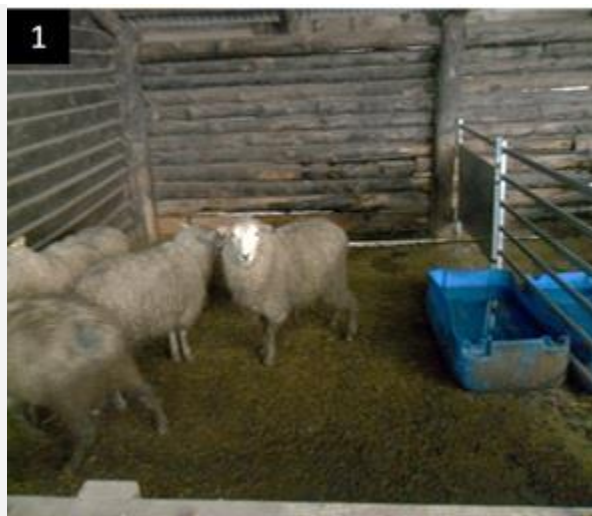
Figura 1. Corderos hacinados en corral sucio y húmedo.

pálido llenando los alveolos. En algunas áreas del corte las lesiones consolidadas mostraban un exudado celular acompañando la congestión y en la luz alveolar se distinguían células inflamatorias con forma de "grano de avena". En bronquios y bronquiolos se observó necrosis del epitelio e infiltrado celular. Estas lesiones sumadas al aislamiento de Mannheimia haemolytica por cultivo microbiológico, confirman que la muerte del animal fue por Bronconeumonía.