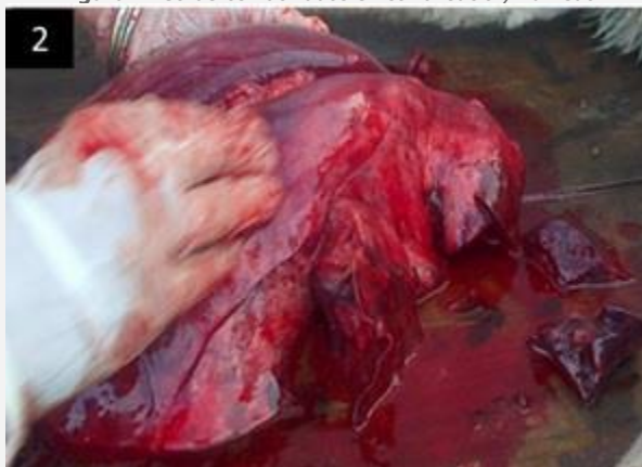
Figura 2. Los pulmones estaban aumentados de tamaño, congestivos y áreas de hepatización en lóbulos craneoventrales.