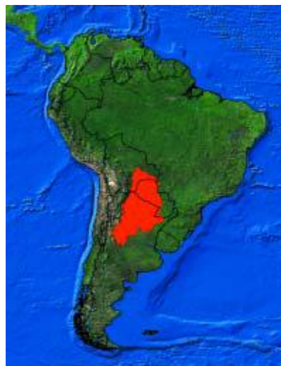
MAPA N°2 Ubicación Gran Chaco Americano

Húmedo se caracteriza por un relieve de muy baja pendiente de Oeste- Este, modelado y organizado por el sistema fluvial (ECO, s/f). A estas condiciones del relieve, se suma la existencia de dos gradientes: térmico y de precipitaciones, el primero, decreciente en sentido norte- sur y el segundo decreciente en sentido oeste- este, que condicionan la aparente uniformidad de la zona, que se manifiesta en diversidad en cuanto a: disponibilidad de agua del sistema hídrico superficial y subterráneo, diversificación de los suelos y en la vegetación: bosque cerrado, un paisaje abierto de parques y sabanas y un horizonte de esteros y bañados enmarcados por selvas en galería. (FVSA; 2005)