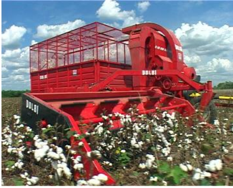
Fig N°3 Cosechadora Tipo Strepeer Algodón