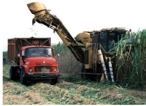
Fig N° 4 Cosechadora Integral caña de Azúcar