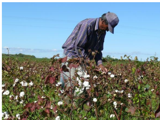
Fig N°1-Cosecha manual Algodón

productores (Cooperativas Agropecuarias, Soc. Rural, etc.). Estos cultivos fueron grandes generadores de Mano de Obra ocupada en la región (Fig. N°1 y N°2).