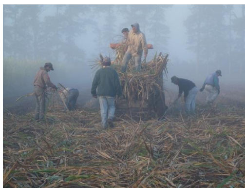
Fig N° 2- Siembra Manual Caña de Azúcar