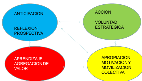
Graf N°1. Fuente Mojica José.(2008) “La construcción del futuro Concepto y modelo de prospectiva estratégica, territorial y tecnológica. Convenio Andrés Bello. Universidad externado de Colombia.

Considerando los momentos de análisis prospectivo; el primero consta de la elaboración de una hipótesis futurable, que consiste en diseñar la configuración social futura que deseamos plasmar: los protagonistas o sujetos de la utopía, su interacción, la lógica y el sistema de sus vínculos, los valores que los orientan, los propósitos que los mueven y los roles que desempeñan. Se trata de diseñar el prototipo de sistema o de sociedad ideal, entendida como desideratum. Para eliminar cualquier vestigio de utopía al método prospectivo, Agustín Merello le antepone algunos requisitos indispensables como la factibilidad, entendida como el conjunto de prerrequisitos necesarios para que en la realidad nuestros deseos; y la aceptabilidad, que no es más que la capacidad de que nuestra idea de futuro deseable alcance cierto consenso o sea compartida por el conjunto de la sociedad.