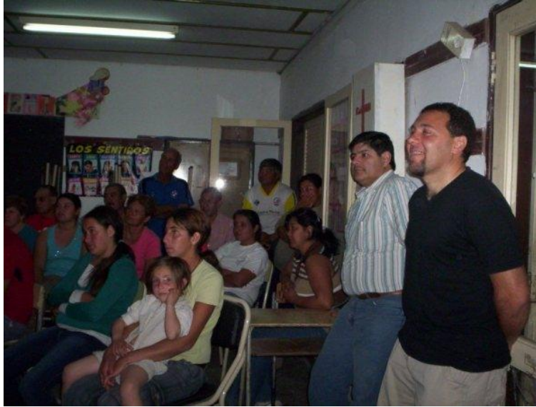
Fig 5. Trabajo en Educación para Adultos, Escuela N° 205.

Lo que se esperaba lograr con esta propuesta desde la escuela para adultos para la comunidad es: