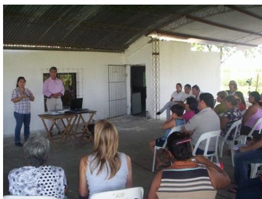
Fig N° 6. Reunión Diagnostico participativo. Comunida La Hortensia.