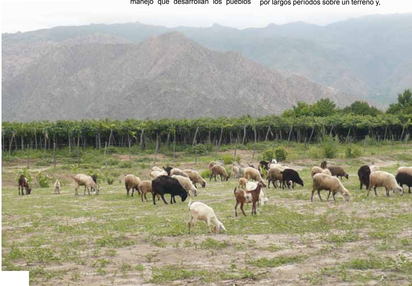
Una práctica sustentable en paisajes desérticos

La desertificación avanza en el planeta y la Argentina no es la excepción. La degradación de los suelos y sus recursos hídricos, producto de ese proceso, suele ser atribuida al sobrepastoreo provocado cuando una cantidad excesiva de ganado permanece por largos períodos sobre un terreno y,