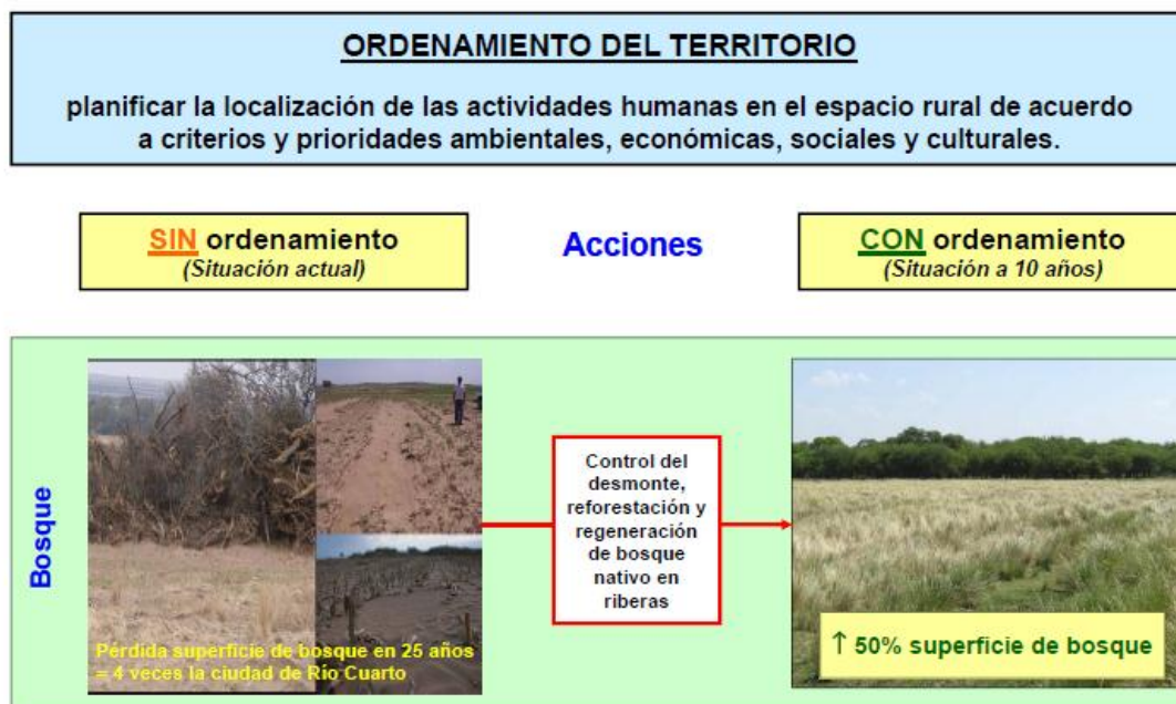
Figura 2. Folleto descriptivo de la situación actual y de la propuesta de un POT rural del sur de la provincia de Córdoba.

En la tercera parte de la encuesta, se procedió a realizar la pregunta de disposición a pagar. La pregunta formulada fue la siguiente: