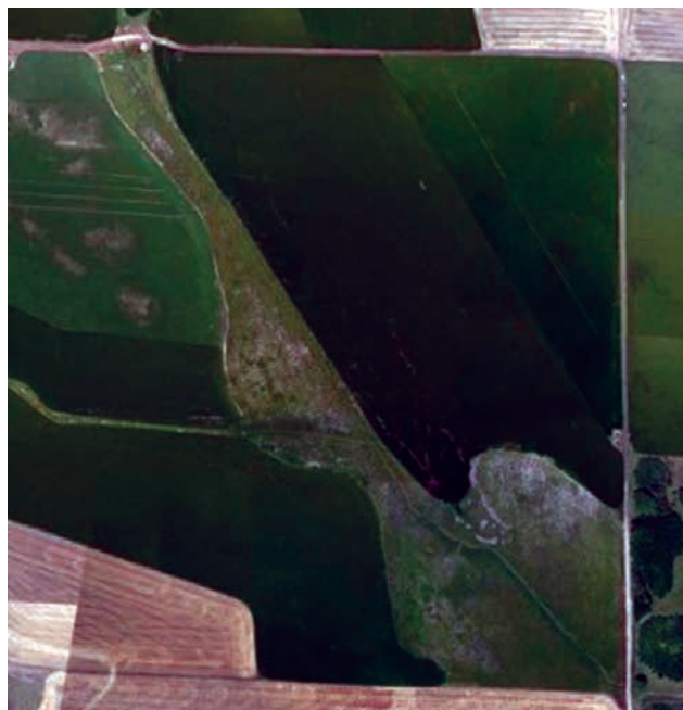
Figura 1. Agricultura de precisión en el establecimiento rural.