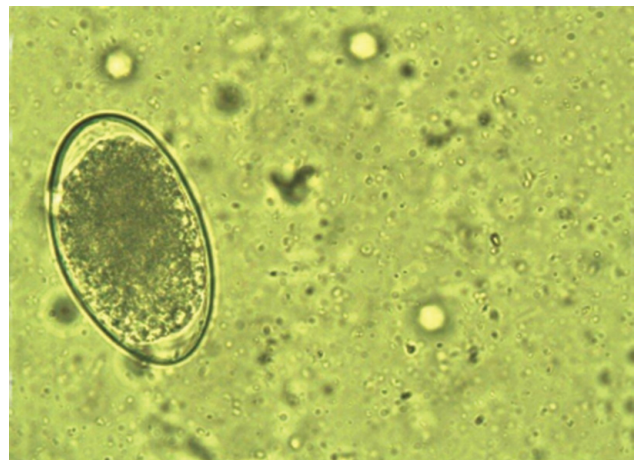
Figura 2. Huevo de nematodos del grupo Ciathostoma (pequeños estróngilos) en un equino de 4 años de edad).

Muchas de las especies que componen el grupo no desarrollan inmunidad protectora y, por lo tanto, son comunes en todas las categorías de equinos (Von Samson-Himmelstjerna, 2012). Todos tienen un ciclo de vida simi-